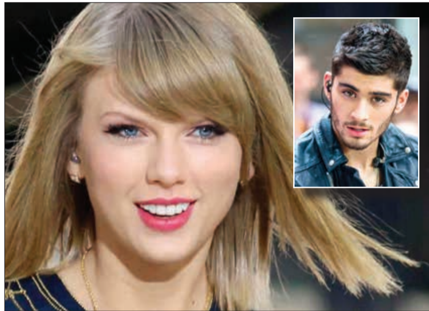
تاييلور سويقت وفي الاطار زين مالك

وكالات: أكثر من 15 مليوناً، والعدد في ازدياد، شاهدوا على «يوتيوب» خلال أيام قلملة الفيديو الجديد لأغنية المطربة الأميركية، تاييلور سويقت، والمغني البريطاني زين مالك، في أول تعاون فني بينهما. واحتاج الفيديو الجديد الذي اطلق يوم 26 يناير الإنترنت، وسقط شائعات تتحدث عن علاقة ناشئة بين النجمين، وكيمياء ما ربطت بينهما في أول لقاء. ومرت سويقت بعدة تجارب عاطفية فاشلة خلال العام الماضي، انتهت جميعها بالانفصال، وأبرزها مع الموسيقي البريطاني، كالفين هاريس، والممثل الأميركي الوسيم، توم هيدليستون. ويرتبط مالك بعلاقة مع الموديل الفاتنة الأميركية ذات الاصل الفلسطيني، جيجي حديد، والتي تناولت أنباء مؤخرًا عن رفضها عرضاً للزواج من المغني البريطاني الشاب. وأغنية سويقت ومالك الجديدة، والتي كشف عنها الشهر الماضي، هي بعنوان Don't Wanna Live Forever، وستكون الأغنية الرئيسية لفيلم Fifty Shades Darker. وقرر النجمان تاييلور ومالك إصدار فيديو كليب خاص بالأغنية التي تحكي معاناة قصة حب فاشلة، ويظهر الاثنان وهما يؤديان في موقعين منفصلين خلال الأغنية في دلالة على الحواجز التي تفصل بينهما.