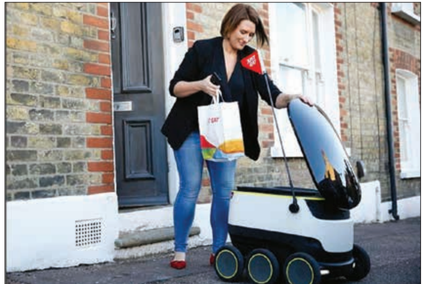
زبونة تتسلم طلباتها من روبوتات «ديليفر»

يصلهم الغذاء حتى عتبات بيوتهم بواسطة الروبوت، فقد أعلنت مؤسسة «دور داش» و«بوست