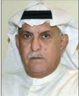
الخبير الفلكي عادل المرزوق

من شدة البرودة في هذه الليالي، خصوصاً من هم في المخيمات في البر. وتابع: هذا الطقس غير المستقر سيسبب سقوط أمطار يوم الخميس القادم في منطقة الجبيل في المملكة العربية السعودية والخليج العربي والسواحل الشرقية منه ومنطقة الاحواز والمناطق المحاذية لجنوب العراق. وفيما يتعلق بحالة البحر، قال المرزوق: سوف تؤثر الرياح الشمالية الغربية على حالة البحر، حيث يكون الموج عالياً حيث تحصل الأمواج العالية إلى 8 أقدام، ما يجعل الدخول للصيد في خلال هذه الأيام محفوفاً بالمخاطر، علماً أن فترة التيارات البحرية خلال هذه الفترة هي تيارات الغساسد الخفيفة الصالحة لصيد السمك ولكن حالة الموج العالي قد تقف عائقاً في دخول البحر.