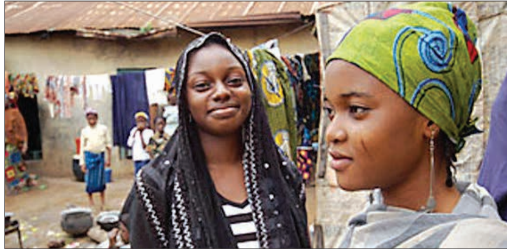
اثنان من زوجاته