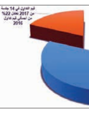
السيولة في 2017