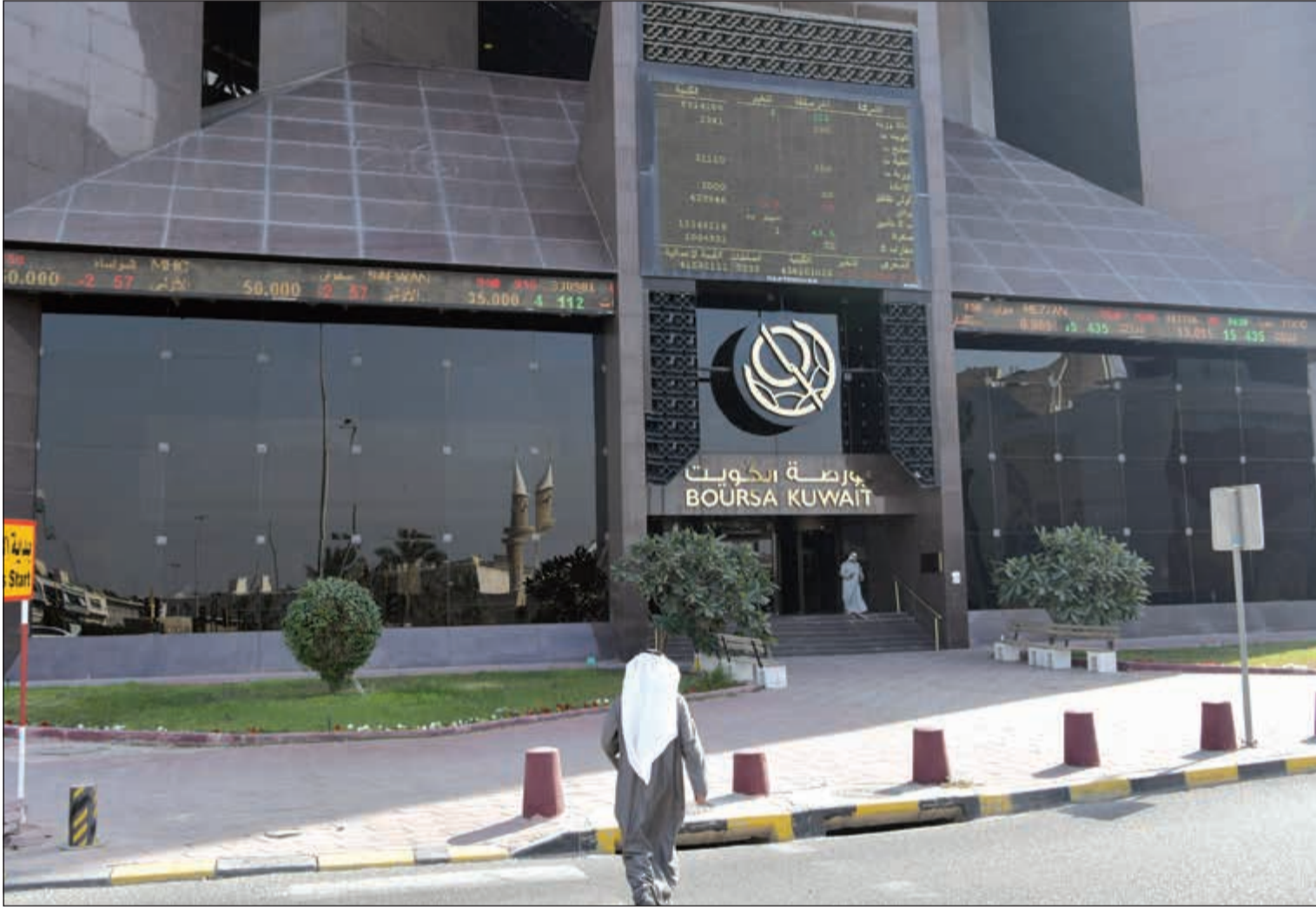
صناديق الاستثمار تنتظر بفارغ الصبر حالة الفوران التي تعيشها البورصة حالياً بعد تكديها خسائر فادحة بالفترة الماضية (قاسم باشا)

■ الفائدة على الودائع بالبنوك المحلية تبتلعها حمى التضخم ■ مليار دينار سيولة البورصة منذ بداية 2017 تعاادل 36% من قيم 2016 ■ مستثمرو العقار يتجهون صوب الأسهم من جديد بعد ركود يعيشه القطاع