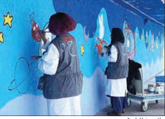
جانب من المبادرة