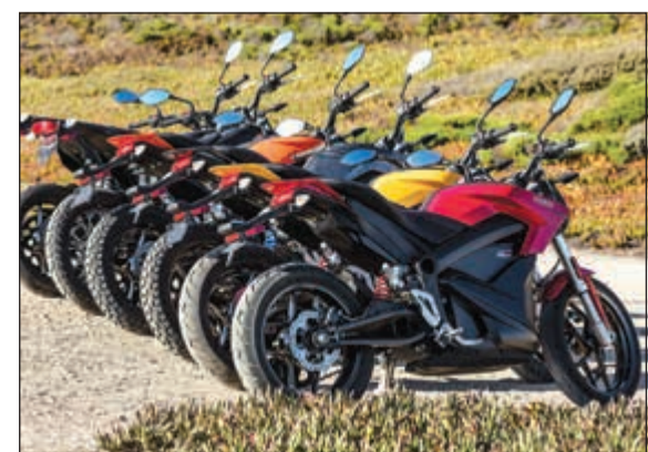
دراجات زيرو موتورسايكلز