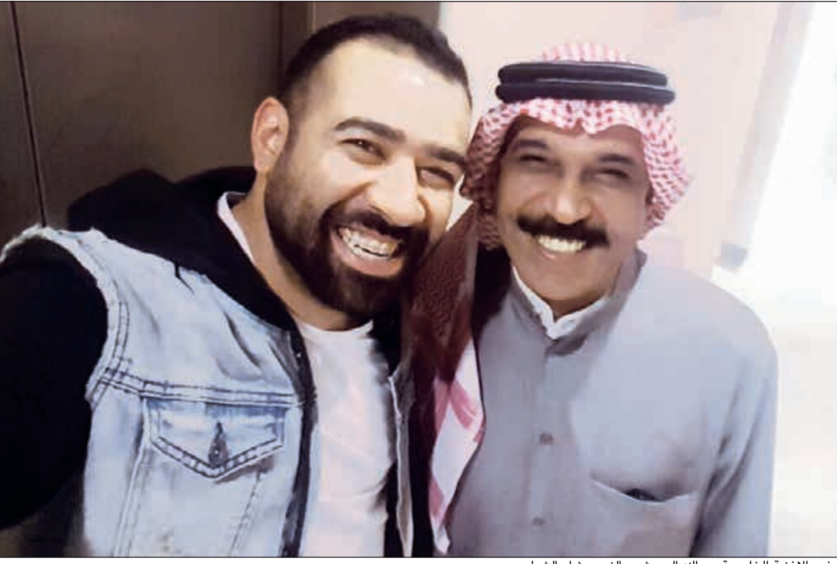
سفير الأغنية الخليجية عبدالله الرويشد والنجم بشار الشطي