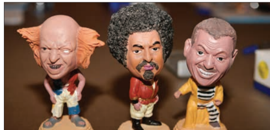
شخصيات فيلم «العتر»