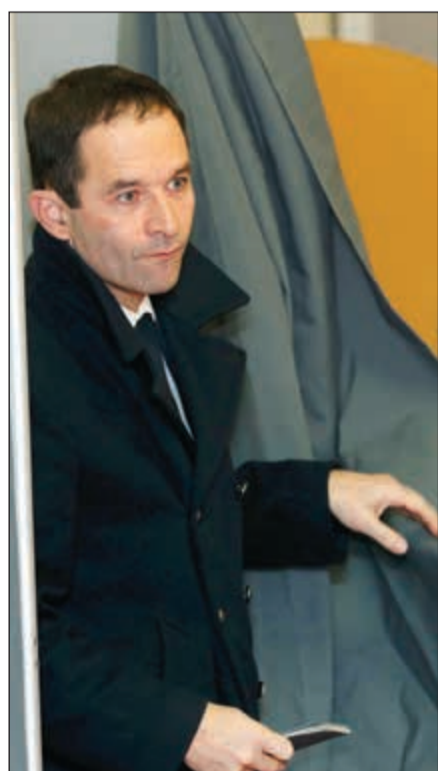
بونوا أمون خلال أدائه بصفته أمون

عواصم - وكالات: أعرب بونوا أمون الذي نافس ضمن الجولة الثانية من الانتخابات التمهيدية لنيل ترشيح الحزب الاشتراكي الفرنسي للانتخابات الرئاسية للبلاد أمس، عن اعتزازه باسم بلال الذي أطلقته عليه مجموعات يمينية متطرفة على سبيل الإساءة والتهمك.