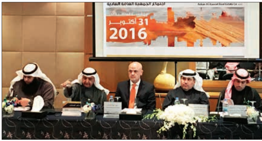
جانب من عمومية أركان الكويت

وأملات الغير دور جيد في دعم الإيرادات التشغيلية في الشركة للسنة القادمة، مبيناً أن الشركة استطاعت الوظيفية اللازمة لهذه الإدارة حتى تكون نتائج أرباحها بالشكل الذي يضيف الي اسم أركان الكويت العقارية في السوق الكويتي. وقال إن الشركة ستسعى قديماً نحو البحث عن فرص الاستثمار التي من شأنها أن تسهم في تحقيق العوائد الجزئية، وتطلعها إلى تحسين أوضاع السوق خاصة السوق العقاري، بما يعيد النشاط إلى الاقتصاد الوطني عموماً، والسوق العقاري على وجه الخصوص.