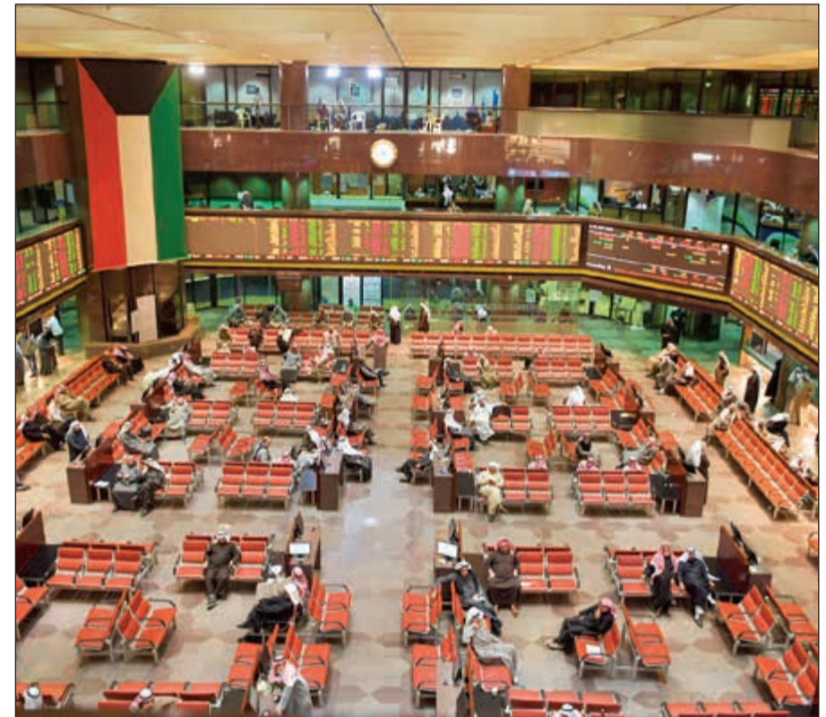
السوق ينتظر صفقة أخرى بمليار دولار.. قبل تواصل المؤشرات قفزاتها؟ (قاسم باشا)

البورصة عبر الوطني للاستثمار وشركة كامكو لتبدأ البورصة بعدها رحلة صعود جديدة من أكتوبر 2016 وحتى يناير الجاري لتبلغ مستويات 6600 نقطة مقارنة بـ 5300 نقطة في أكتوبر لتتحقق مكاسب بلغت 1300 نقطة وبنسبة صعود 24.5٪. وتوقعت السوق بسبب عودة قادمة بعد تنفيذ صفقة جديدة بمليار دولار منتصف الشهر المقبل لاستحواذ «أديتيو» على حصة الأقلية في «أمريكانا».