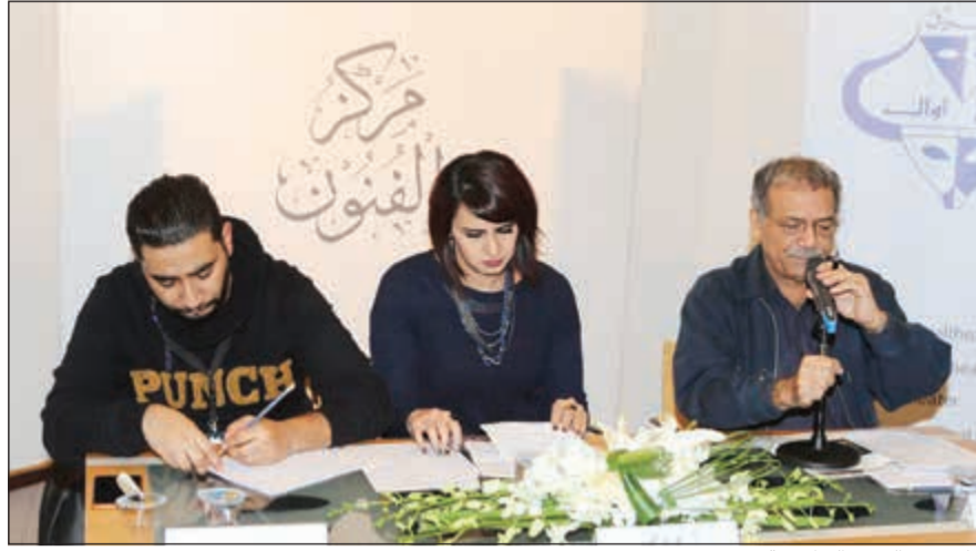
جانب من الندوة التطبيقية