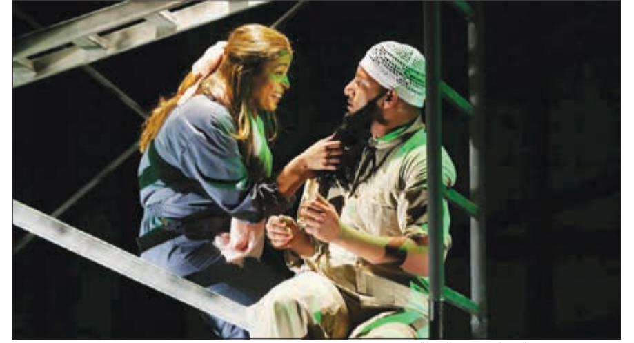
مشهد من مسرحية «خازوق في الحفلة»