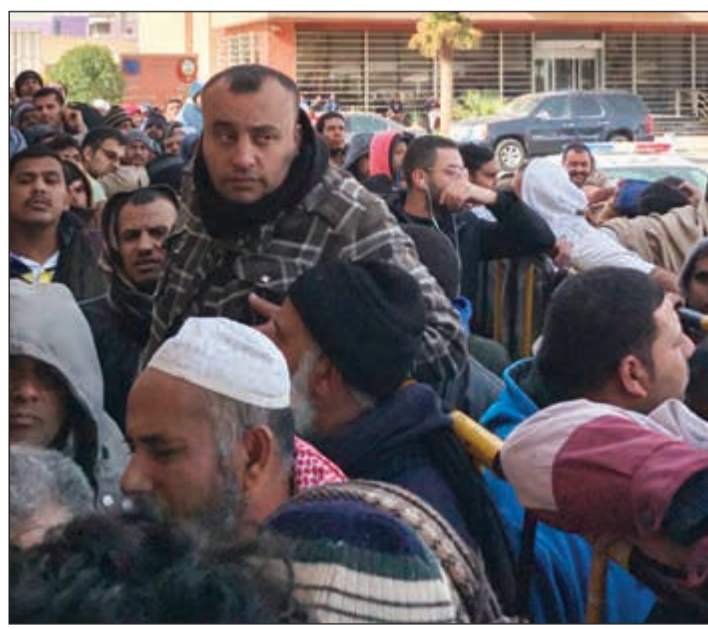
أعداد غفيرة بانتظار الدور لإنجاز معاملاتهم