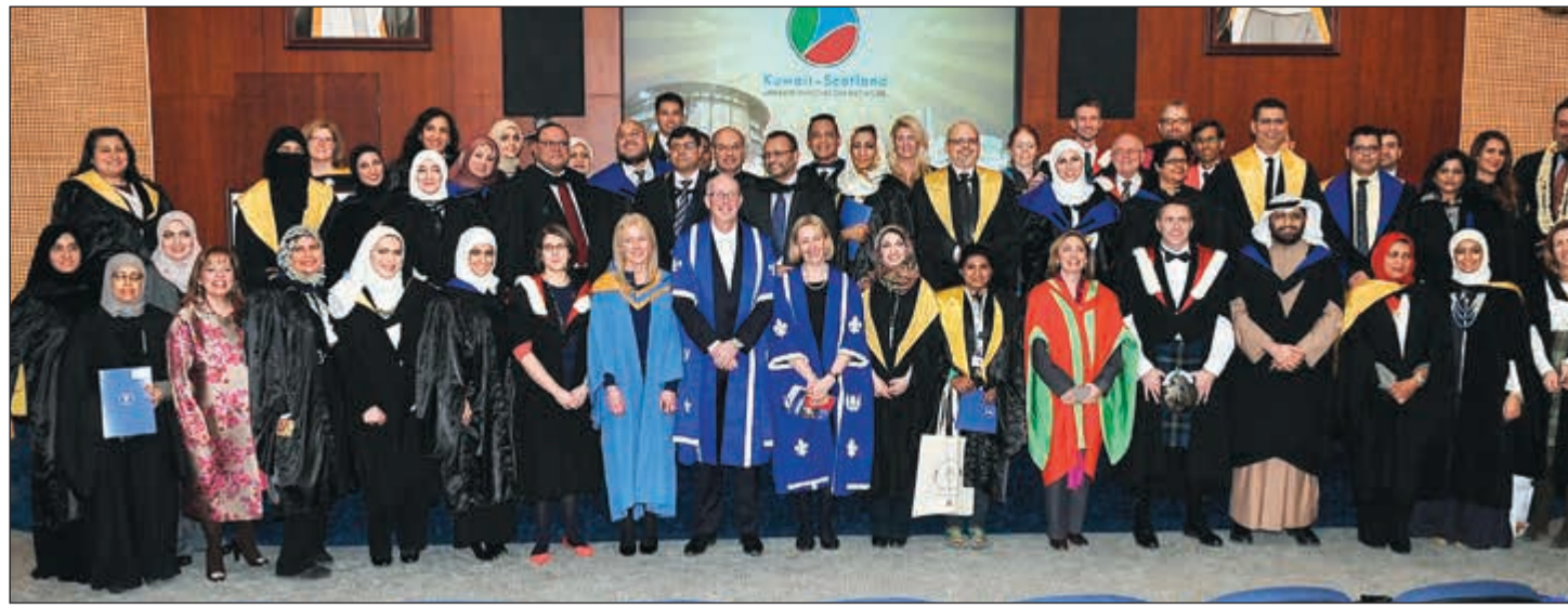
صورة تذكارية للأطباء الخريجين بعد تكريمهم (زين علام)