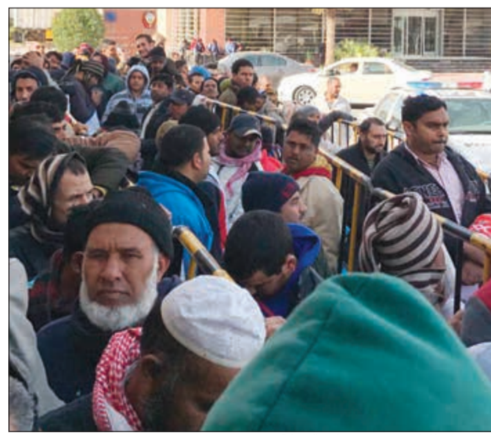
حشود من المراجعين بسبب تعامل الشركة

لكن الأمر تجاوز أسبوعاً مما كلفه تغيير الموعد بأكفلة جديدة. وبسبب التوتر السائد والضغط العصبى الكثير من المراجعين لا تضي دقائق إلا ويرتفع صوت مشادة.. ويظل المراجعون على نفس المنوال لساعات متراصين على أمل إنهاء المعاملات. وفي المقابل استمرت وزارة