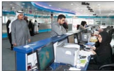
جانب من عملية تسجيل الجداول الدراسية في عمادة القبول والتسجيل