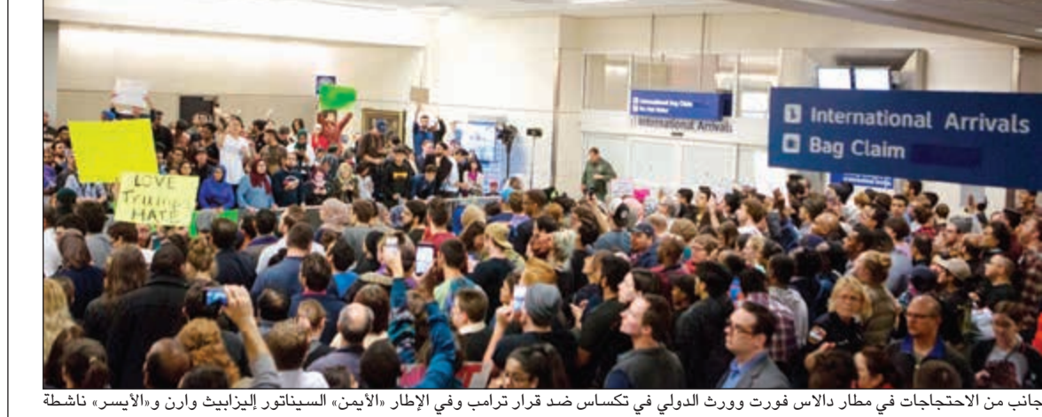
جانب من الاحتجاجات في مطار دالاس فورت وورث الدولي في تكساس ضد قرار ترامب وفي الإطار «اليمين» السيناتور إليزابيث وارن و«اليسار» ناشطة أميركية تشارك في الاحتجاجات

واشنطن - وكالات: بدأ الأسبوع الثاني من ولاية الرئيس الأميركي دونالد ترامب السلطة في البيت الأبيض، بإطلاق قراراته الصادمة في مجال الهجرة، طارحا ما يسميه «الحقائق البديلة»، ومتسببا بهزات في واشنطن والعالم كما سبق أن وعد. وفيما بدأت ملامح «التمرد» على قرار ترامب في الظهور بعد إعلان مسؤولو ولايات بنسلفانيا وواشنطن وهاواي أنهم يدرسون رفع دعاوى قضائية لإبطاله، غرد الرئيس الأميركي دونالد ترامب أمس على حسابه على «تويتر» قائلا إن أميركا تحتاج إلى «حدود قوية» و«عمليات تدقيق مشددة»، مضيفا في تغريدته «بلادنا تحتاج إلى حدود قوية وعمليات تدقيق