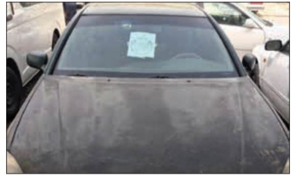
إحدى المركبات التي تمت مخالفتها

نفذ قطاع الأمن العام أمس حملة مباغثة على عدة كراجات في منطقة الصليبية الصناعية، حيث تم تحرير مخالفات لعدد منها تقوم بتصليح مركبات من دون إذن صادر عن محقق وزارة الداخلية. تاتي الحملة التي نفذها قطاع الأمن العام في الصليبية وغيرها من الأماكن الصناعية بينها الشويخ والفحيحيل عقب تقارير تفيد بإقدام عدد كبير من الوافدين ارتكبا