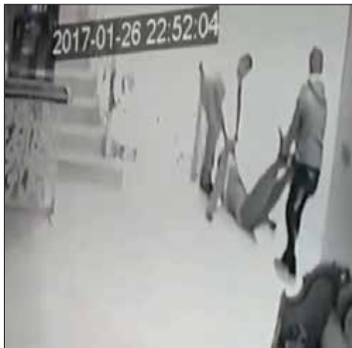
.. ويحمل الجثة وآخر في المنزل الخالي