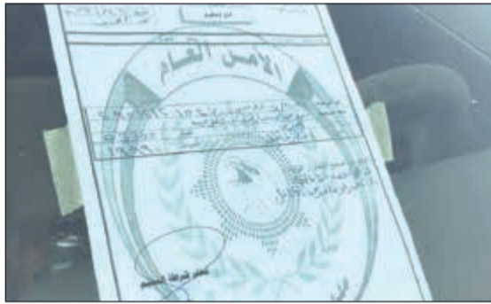
مخضر المخالفة ترك على زجاج المركبة

حوادث على التردد لإصلاح سياراتهم دون العودة الى وزارة الداخلية ومن بين من قاموا بهذه الخطوة