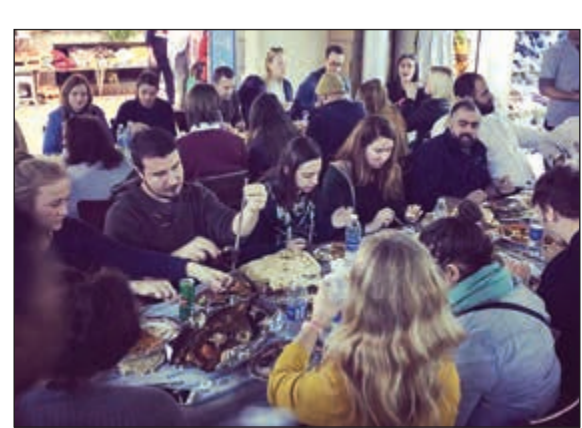
جانب من حفل العشاء