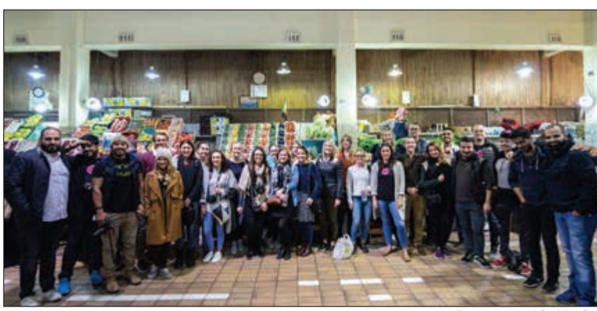
لقطة تنكارية لهواة ومحبي التصوير

أقامت المدرسة البريطانية بالكويت أحد أهم الأحداث الاجتماعية وهي الـ Photowalk، حيث في هذا الحدث يتجول مجموعة من هواة ومحترفي التصوير في مناطق معينة لالتقاط الصور. وأقيم هذا الحدث يوم الجمعة 20 يناير 2017، حيث توجه مجموعة من 34 شخصاً من هواة ومحترفي ومحبي التصوير إلى منطقة المباركية، حيث قاموا بأخذ مجموعة من الصور التي تعكس وتبرز الكويت القديمة. والهدف من إقامة هذا الحدث هو تطوير وزيادة التفقيف بماهية التصوير الفوتوغرافي، وكذلك تعزيز