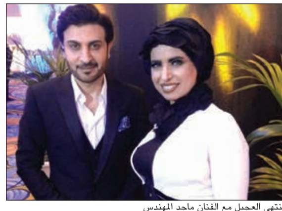
منتهى العجيل مع الفنان ماجد المهندس