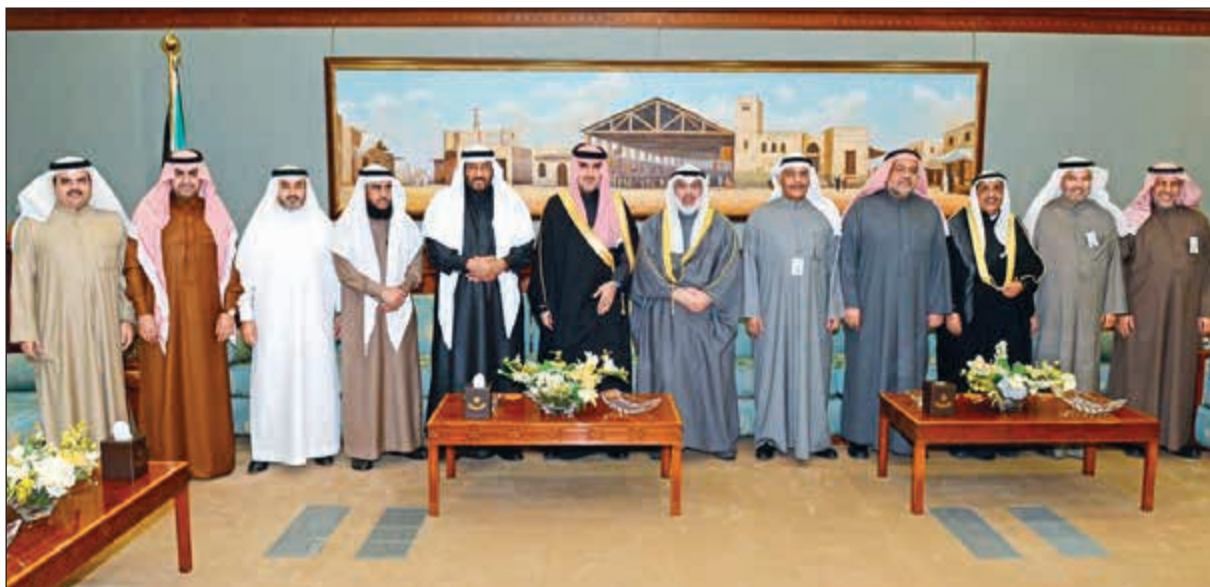
عادل الصرعاوي في استقبال د. حسام بن العنقري والوفد المرافق

حسام العنقري تشرف خلال زيارته بقاء صاحب السمو الأمير الشيخ صباح الأحمد، وسمو ولي العهد الشيخ نواف الأحمد، ورئيس مجلس الأمة مرزوق علي الغانم، ورئيس مجلس الوزراء سمو الشيخ جابر المبارك. وأشارت الحشاش إلى حرص ديوان المحاسبة على توطيد العلاقات مع الأجهزة الرقابية أعضاء المنظمات الإقليمية والدولية التي ينتمي لها ديوان المحاسبة والبحث عن الخبرات والتجارب الناجحة لدى تلك الأجهزة.