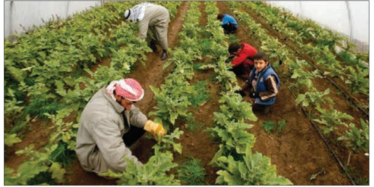
دعم المنتج المحلي يعزز من دور المزارع الكويتية في توفير الأمن الغذائي