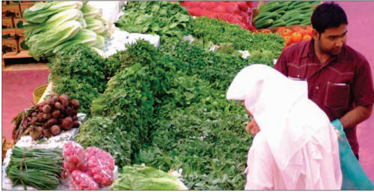
ضوابط وشروط لدعم المنتج المحلي عبر ركن «المزارع الكويتية» في الجمعيات التعاونية