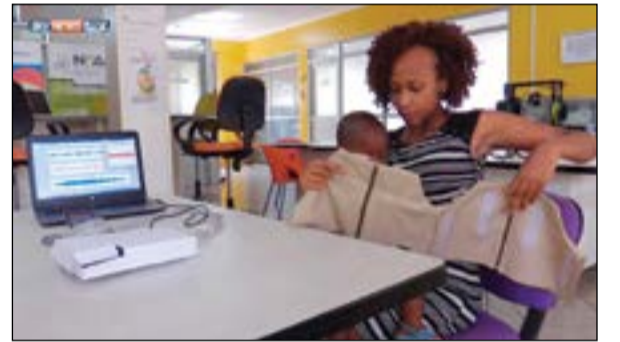
السترة الذكية اختراع أوغندي

كمبالا - أ.ف.ب: اخترع فريق من المهندسين الاوغنديين «سترة ذكية» قادرة على تشخيص الإصابة بالتهاب رئوي أسرع من الأطباء، ما يسبح بمكافحة هذا المرض الذي يحد أكبر عدد من الضحايا الأطفال في العالم.