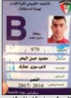
تقييد البحر في كشوفات النصر