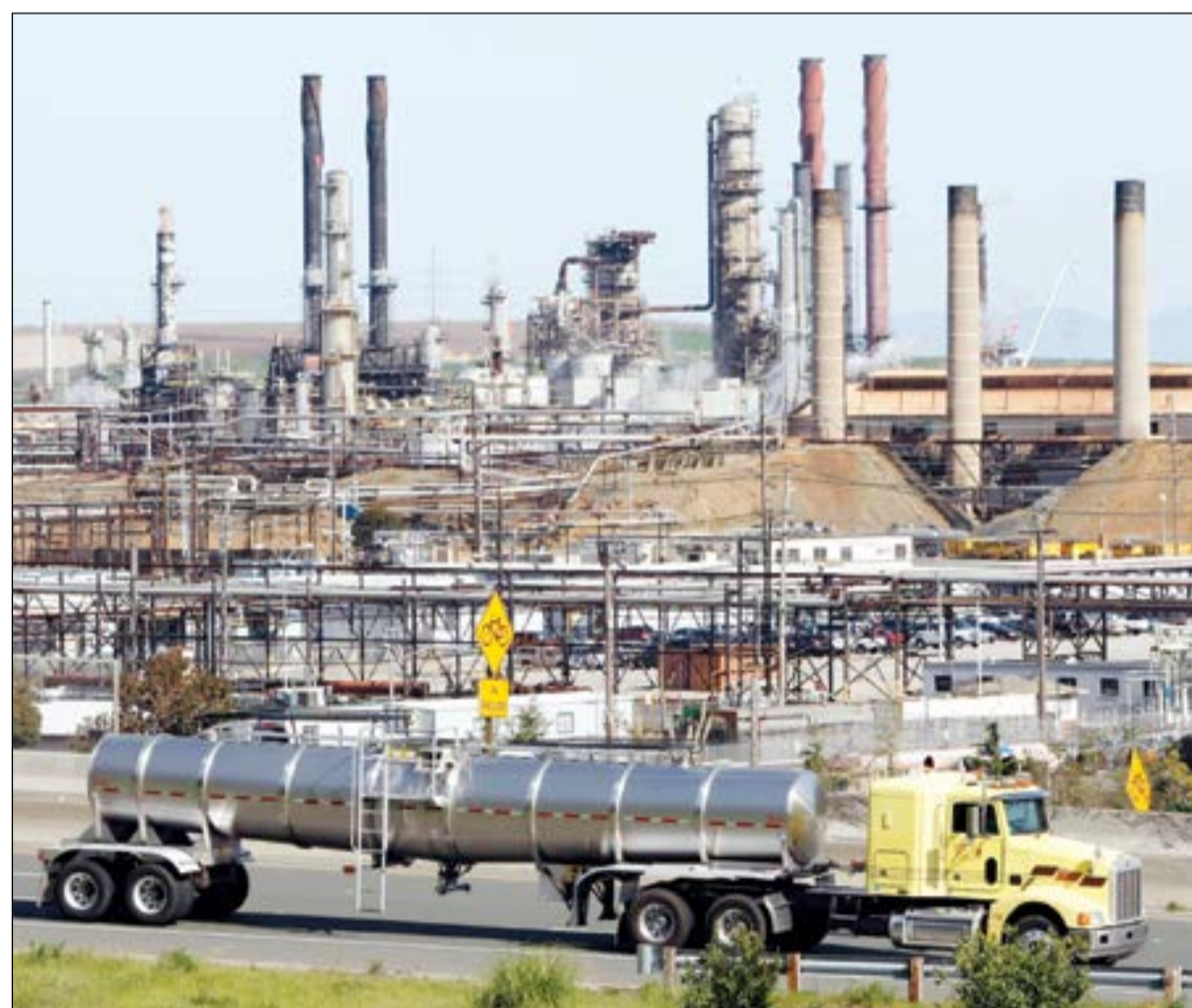
عودة الإنتاج الأميركي للنمو بقوة تمحو جهود «أوبيك» في خفض الإنتاج.. وفي الصورة شاحنة تعبر بجانب مصفاة نفط في كاليفورنيا

صادرات النفط الإيرانية ترتفع في فبراير مع بدء الاستيراد الإندونيسي تصدير 600 ألف برميل يوميا من المنتجات النفطية الإيرانية في 2017 تزايد شحنات النفط الإيراني إلى آسيا لأعلى مستوياتها في 3 أشهر