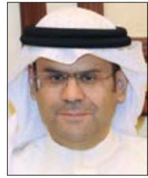
د. سعد الصباح

البابطين: نقطة تحول كبيرة في تاريخ الحياة الثقافية الكويتية