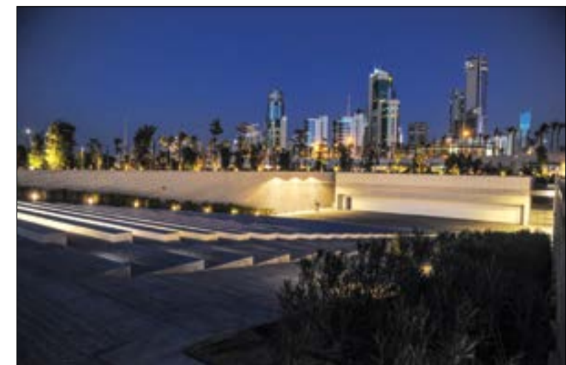
حديقة العلم تحتضن المسرح الروماني