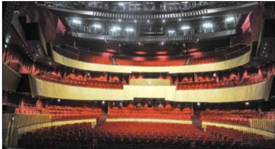
المسرح الوطني هو أكبر مسرح في مركز الشيخ جابر الأحمد الثقافي