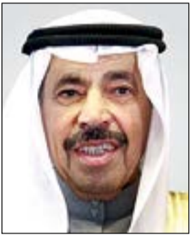
عبد العزيز البابطين

مكعب بينما احتاج البرج إلى 27600 متر مكعب فقط. ومن ناحية الأيدي العاملة واصل نحو 10 آلاف عامل الليل بالنهار حتى أنجزوا المركز عبر 14 مليون ساعة عمل بمشاركة عمالة كويتية بلغت نسبتها 20٪ من إجمالي العاملين في المشروع وبلا أي إصابات تذكر طوال العمل في المشروع. وعن فكرة إنشاء المشروع حتى خرج بشكله الحالي قالت مديرة إدارة المراكز الثقافية في الديوان الأميري م. سحر العقاب لـ «كويتا» إن الإدارة الهندسية في الديوان الأميري هي صاحبة هذه الفكرة التي استندت من الوضع الإقليمي للكويت باعتبارها جوهرة الخليج ومركز إشعاع وعاصمة للثقافة الإسلامية لافتة إلى الاستعانة بالمستشارين الفنيين في الديوان الأميري لصياغة الفكرة.