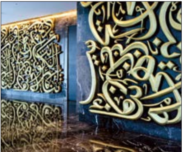
مقولة الشيخ جابر الأحمد (إننا من الكويت نبداً وإلى الكويت ننتهي) تزين أروقة المركز

ويعد المركز من أسرع ويمتد المركز من أسرع