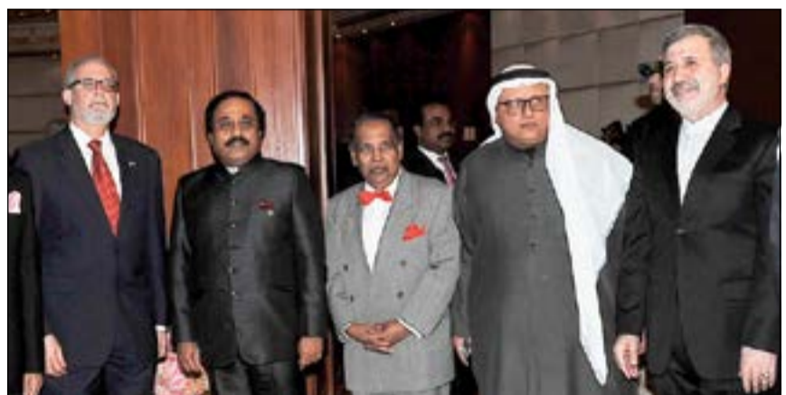
السفيران الأميركي لورانس سيلفرمان والإيراني دعلي رضا عنايتي وعدد من الحضور في حفل السفارة الهندية

عودة النفط الصخري تمحو جهود «أوبك» في خفض الإنتاج تعيين شركتين أمريكيتين لتقييم احتياطيات «أرامكو» قبل الإدراج 24