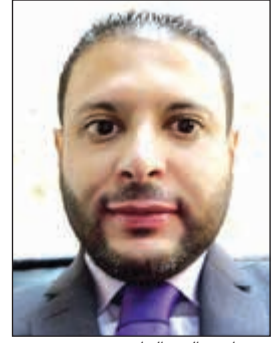
د. جاسم العبدالهادي

والذين كانت لهم بصمة واضحة في تخصصاتهم الطبية ورفع اسم الكويت في المحافل العلمية، داعياً الوزير إلى الاستمرار في النهج الإصلاحي وسياسة الباب المفتوح والتي تقرب المواطنين والموظفين منه. كما ندعوه لعدم الالتفات للأصوات الشاذة والتي للأسف يب فيها داء الحسد من كل عمل مميّز وتطوير يقوم به معاليه، فهذه الأصوات للأسف لا يهتما بها إلا تضييق الهمم والنيل من الأعمال الجبارة التي تقام حالياً بوزارة الصحة، لذلك نقول للوزير: سر على بركة الله وتوفيقه، فجموع الكويتيين تنتظر منك الكثير بعد ما لمست منك صدق النية والعمل والدؤوب.