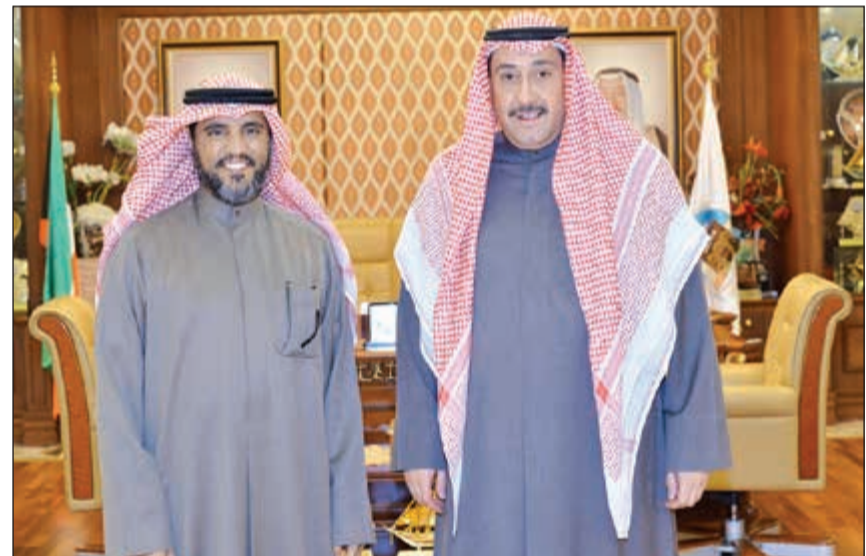
الشيخ فيصل الحمود مستقبلاً د.حسين قويحان

لدعوة المحافظ لتكريم عدد من الموظفين المتميزين في إدارة القوى العاملة. وأكد الحمود أن تكريم المتميزين والمبدعين في عملهم واجب على الجمعية، كون نجاح أي مؤسسة يرتبط ارتباطاً وثيقاً بنجاح موظفيها والعمل كفريق واحد شعاره التعاون. وعلى صعيد آخر، استقبل الشيخ فيصل الحمود المؤلف د.عبدالله بوير الذي أهدى المحافظ لوحة تذكارية لتكريم صاحب السمو من الأمم المتحدة وكتابه الجديد «خطبات حضرة صاحب السمو».