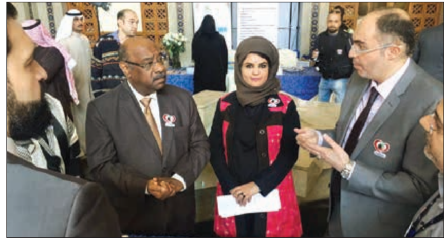
د. محمد الخشتي ود. حنا الوطيان ود. أحمد الصراف

أكد وكيل وزارة الصحة المساعد لشؤون القطاع الأهلي بوزارة الصحة د.محمد الخشتي انتهاء الإشكالية التي واجهتها إدارة التراخيص الطبية في مسألة معادلة الشهادات الطبية للمهن الطبية بالكامل من طب بشري وأسنان وطب مساند، مبينا أنه كان هناك تعثر لبعض الوقت ولكن تم الاستئناف بالعمل مؤخرا بعد حل المشكلة.