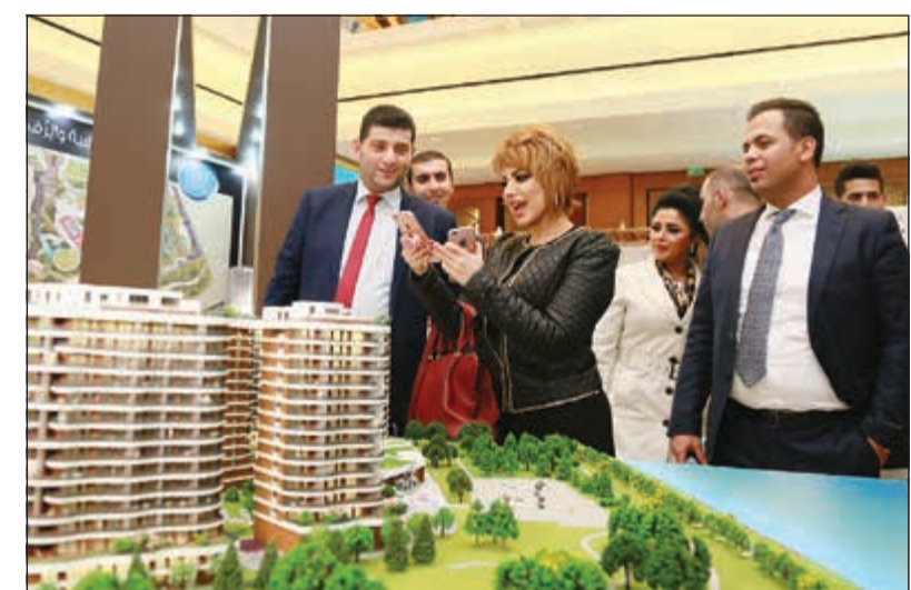
بولند في زيارة لجناح دار الجوار