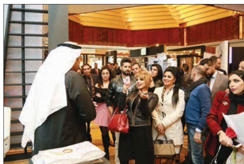
.. وزيارة لجناح إحدى الشركات المشاركة في المعرض