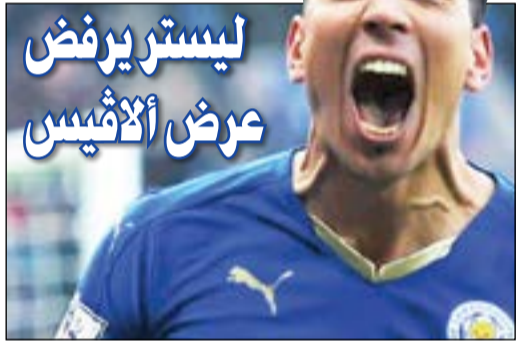
بقاء الأرجنتيني مع الشباب

أكدت تقارير صحافية عالمية أن المدرب الإسباني بيب غوارديولا المدير الفني لنادي مان سیتی يرغب في التعاقد مع مواطنه خوان بيرنات مدافع نادي بايرن ميونخ الألماني، خلال الميركاتو الصيفي المقبل. وأنضم خوان بيرنات إلى البافاري في صيف 2014، قادماً من نادي فالنسيا الإسباني في صفقة بلغت قيمتها نحو 20 مليون جنيه إسترليني بطلب من الفيلسوف بيب الذي كان مدرباً للعملاق الأحمر حينها. ويرى غوارديولا أن مواطنه بيرنات لاعب بايرن والهولندي فيرجيل فان دايك لاعب ساوثمبتون سيكون أحدهما الحل لمعالجة الأخطاء الدفاعية بنادي السيتي خلال هذا الموسم. ويقدم الإسباني بيرنات أداءً رائعاً للغاية مع النادي الألماني.