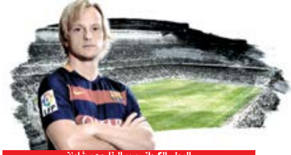
الدولي الكرواتي يبريد البناء مع برشلونة