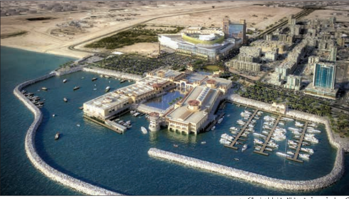
أكبر واجهة بحرية متعددة الاستخدامات في الكويت