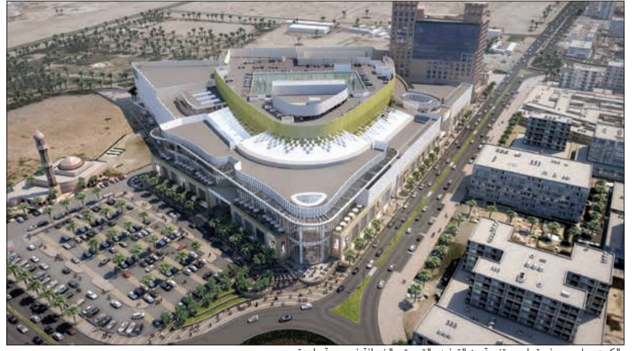
«الكوت مول، سيوفر تجارب متنوعة من الترفيه والتسوق والضيافة في وجهة واحدة»