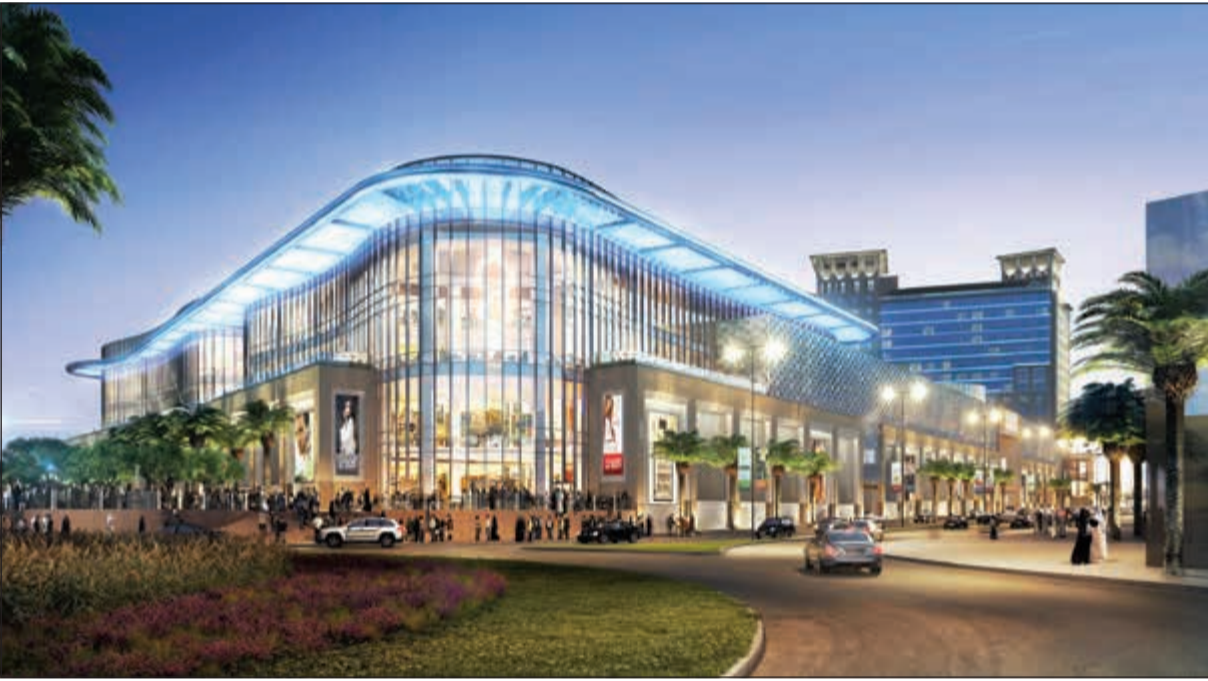
المشروع سيمزج بين أصالة العمارة التقليدية وحداثة التصميم

التسوق العصرية، بحيث يوازن بين التصميم العملي والتجربة الممتعة، وهو جزء من مشروع تطوير «الكوت» في محافظة الأحمدى، وهو أكبر واجهة بحرية متعددة الاستخدامات في الكويت. وسيقدم المشروع بين أصالة العمارة التقليدية وحداثة التصميم وسيوفر ست تجارب متنوعة ومميزة من الترفيه والتسوق والضيافة في وجهة واحدة تصل مساحتها إلى 300 ألف متر مربع، يمكن للزوار التنقل بسهولة وسلاسة بين أرجائها. ويتماشى «الكوت مول» مع استراتيجية مجموعة التمدين لتطوير قطاع التجزئة والترفيه في الكويت، ويساهم في تشجيع رواد الأعمال على المشاركة في مسيرة التنمية الاقتصادية والتجارية في البلاد.