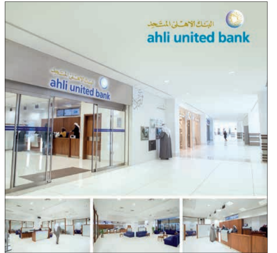
فرع البنك الأهلي المتحد في بوليفارد السالمية

تمتasha مع استراتيجية البنك الأهلي المتحد في التوسع والانتشار المستمر، وحرصه المستمر على الوصول لعملائه أينما كانوا، جاءت مبادرة البنك الأهلي المتحد بفتح فرع جديد ليكون أول فرع للبنوك في بوليفارد السالمية لتعكس سعي البنك للوصول إلى أكبر شريحة من عملائه أينما كانوا، ليحظوا بأفضل الخدمات المصرفية التي تلي توقعاتهم بمنتهى السهولة في الوقت الذي يزاولون فيه نشاطهم الترفيهي، حيث ستمدد ساعات دوام الفرع خلال الفترتين الصباحية والمسائية، كما تم تجهيز الفرع الجديد بكل متطلبات العملاء من ذوي الاحتياجات الخاصة لضمان التيسير عليهم وتلبية مختلف احتياجاتهم المصرفية بما يتناسب مع ظروفهم. ويأتي اختيار بوليفارد السالمية كموقع لأحدث أفرع البنك المصرفية في الكويت، نظراً لموقعه الاستراتيجي في قلب منطقة السالمية وباعتباره أكبر محور سياحي يمتد على مساحة 353 ألف متر مربع مليئة بالفعاليات والأنشطة الثقافية والترفيهية، وواحد من أهم وأحدث المجمعات التجارية والترفيهية في الكويت، لذا فإن تواجده بالقرب من شريحة كبيرة من الزوار. وفي هذا الإطار تم تصميم فرع البنك الأهلي المتحد في بوليفارد السالمية بشكل يضع راحة العملاء فوق كل اعتبار، إذ يساعد التصميم الجديد للفرع على الشعور بالراحة ورعاية الاستقبال، كما يساعد اختيار الألوان والأثاث على توضيح الطابع العمري والراقي للفرع بشكل يتماشى مع الطبيعة الحيوية للمنطقة التجارية والترفيهية، بالإضافة إلى تجهيز الفرع بأحدث الوسائل التكنولوجية بما يرتقي