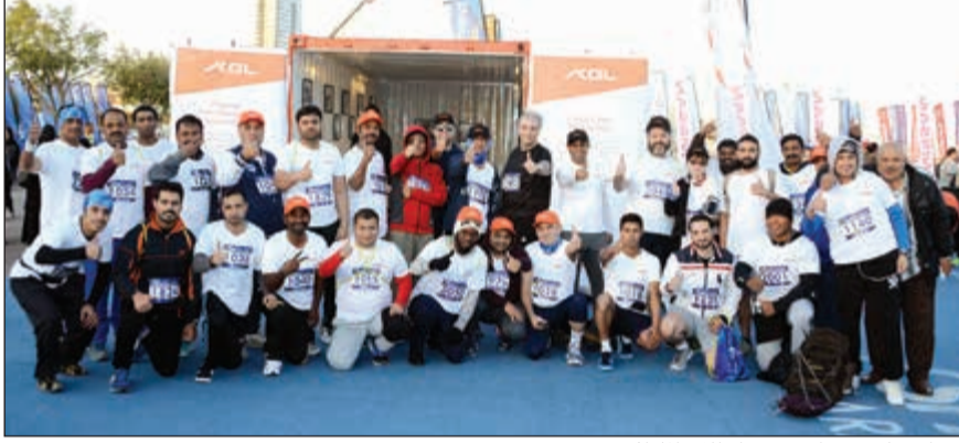
موظفو «كي جي إل» قبيل انطلاق الماراثون

وأكد الداود أن الشركة تستمد أهداف برنامجها للمسؤولية الاجتماعية من رؤية «قائد الإنسانية» صاحب السمو الأمير الشيخ صباح الأحمد الذي جعل من الكويت منارة للعمل الإنساني في مختلف دول العالم، مشيراً إلى أن ما حثت الشركة على رعاية هذا الحدث أن ريعه يتم التبرع به لصالح الجمعيات الخيرية المحلية والعالمية. وقال الداود إن نحو 81 موظفاً من جميع الشركات التابعة والزميلة لشركة كي جي إل القابضة شاركوا في ماراثون سبارك 2017 والذي شارك فيه أكثر من 3 آلاف مشارك من الرجال والنساء من مختلف الجنسيات المتواجدة على أرض الكويت الذين سجلوا أسماءهم في السباق. وأوضح أن من أهم ما يميز أهداف الماراثون أنه يعزز ثقافة الرياضة وأهميتها في التوعية الصحية لدى المواطنين والمقيمين على أرض الكويت، وكذلك تعزيز الجانب الإنساني