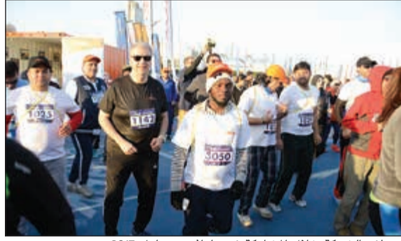
موظفو الشركة خلال المشاركة في ماراثون سبارك 2017

من خلال التبرع بربع الماراثون لدعم جمعية حياة لمرضى سرطان الثدي والمفوضية السامية للأمم المتحدة لرعاية شؤون اللاجئين. وذكر أن ما يميز هذا الحدث مشاركة عدد من المتسابقين المصنفين عالمياً للمنافسة على الفوز بجوائز بلغت قيمتها نحو 100 ألف دولار. وأشاد الداود بجهود رئيس اللجنة المنظمة للماراثون عبدالمحسن الباطين وكل أعضائها، وكذلك الدور المتميز لوزراء الداخلية التي بذلت جهوداً حثيثة لنجاح هذا الحدث الذي يؤكد قدرة الكويت في تنظيم فعاليات عالمية، مؤكداً أن تاريخ شركة كي جي إل على مدى 60 عاماً في دعم الاقتصاد