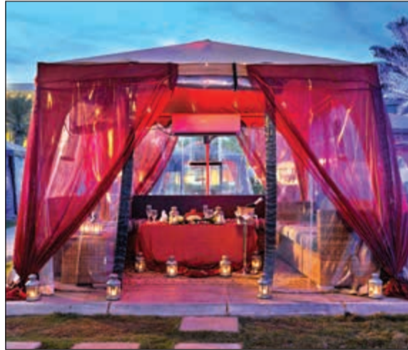
عشاء فاخر في إطلالة رومانسية

تمكنت من رفع عينيك عن شاطئ الخليج الخلّاب. كما يوفر تراس «بالم كورت» ما لذ وطاب من المأكولات العربية الأصيلة، وقائمة واسعة من المشروبات المنعشة، ولاستكمال الأمسية الخاصة، يمكن تناول الشيشة التقليدية ربما تتمتع بمشهد رائع على ضفاف الخليج العربي، وتراس «بالم كورت» هو المكان المثالي لأولئك الباحثين عن أوقات رومانسية رائعة، هذا ويوفر المنتجع باقات خاصة للعشاء الرومانسي تشمل الاختيار من قوائم طعام مختلفة، إلى جانب زجاجة من عصير العنب