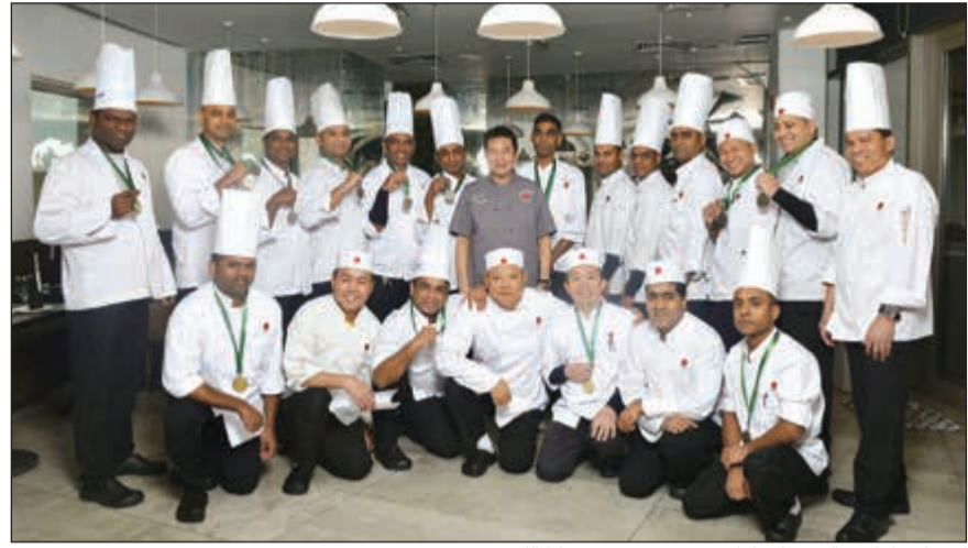
احتفال طهاة «ماكي» بإنجازاتهم في معرض هوريكا الكويت 2017

المواهب، والعمل الملتزم والدائم في البحث والتطوير، ودايمًا يسعى مطعم ماكي لإرضاء زبائنه الكرام من خلال الاستثمار في بناء مهارات موظفيه وطهانه، وتدريبهم لوصول بأدائهم المهني لأعلى المستويات.