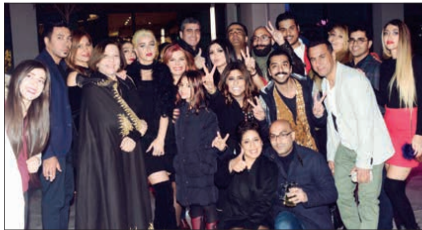
لقطة جماعية لفريق العمل