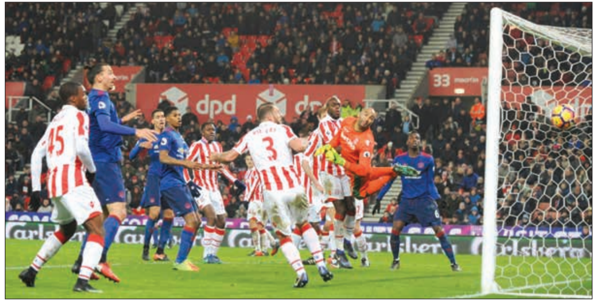
كرة واين روني تعانق شبك ستوك سيتي

على ليفربول مفاجأة كبيرة عندما اسقط ليفربول المنافس على اللقب في مقر داره 2-3، أمس في المرحلة الثانية والعشرين من الدوري الإنجليزي لكرة القدم، فيما انقذ واين روني مان يونايتد من الخسارة بهدف قياسي قاتل امام سوانزي (1-1). وكان ليفربول يتحدي الفرصة لاستعادة المركز الثاني من توتنهام، لكنه فشل في اختباره السهل امام ضيفه الويلزي الذي حقق فوزه الأول عليه في مقر داره في البريميرليغ. وتجسد رصيد ليفربول عند 45 نقطة في المركز الثالث مؤقتا. اما سوانزي فقد صعد مؤقتا من ذيل الترتيب الى المركز