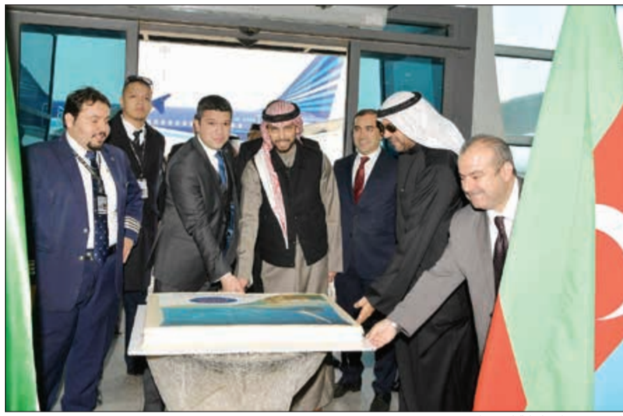
جانب من تقطيع كيكة الاحتفال

الكاظمي: «نطلق في الوقت الحالي رحلة شهرية نظراً الى الجو الشتوي القارس، وستنطلق الرحلة المقبلة في العيد الوطني مع العلم ان 60% من التذاكر تم حجزها، وفي فصل الصيف ن فكر بإطلاق رحلتين بالأسبوع». وأضاف الكاظمي: «تصل سعر الرحلة الى 275 ديناراً، وتشمل تذكرة السفر والمواصلات والإقامة في فندق 5 نجوم وبرامج سياحية لمدة 4 ليال و5 أيام». وأشار الكاظمي الى انه بإمكان المواطنين استخراج التأشيرة لدى وصولهم الى مطار أذربيجان، مبيناً ان أذربيجان قريبة جداً من الكويت، اذ تستغرق