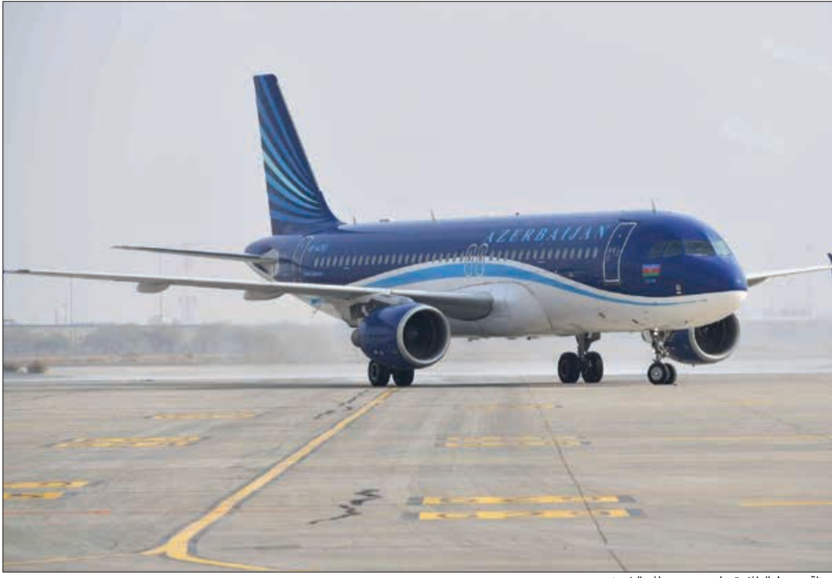
لحظة هبوط الطائرة على مدرج مطار الشيخ سعد