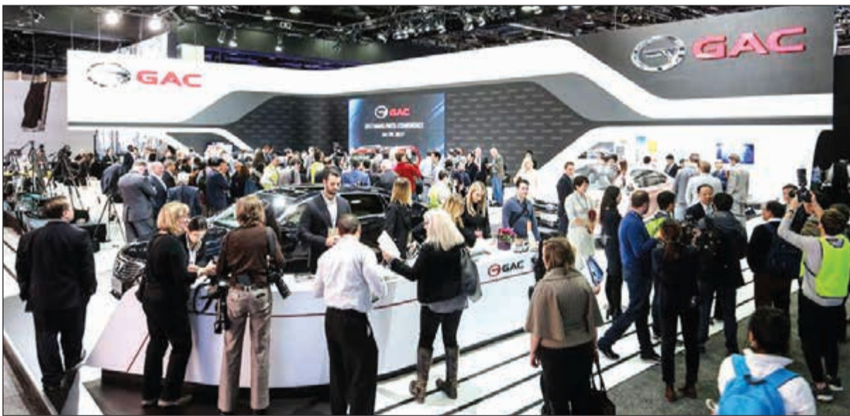
جناح «جي أيه سي موتور» في معرض ديترويت