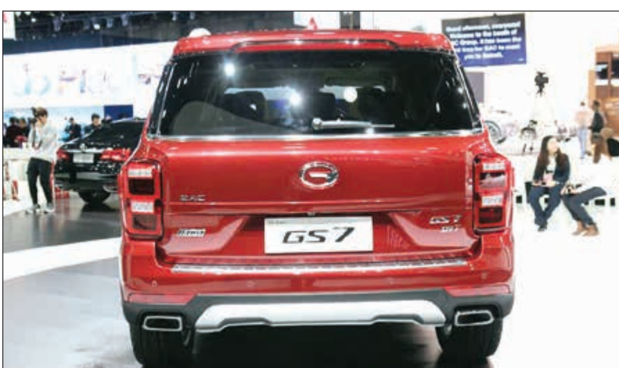
سيارة جي أس 7 الجديدة

الهيكل الأمامية التفكير التي طورها قسم هندسة جي أيه سي بهدف تقديم موقف من الحرية والتقدم والمتعة عبر التصميم المشترك للسيارة السيدان والرياضية القابلة للتحويل. وستحمل السيارة الجديدة ذات الخمسة مقاعد جي أس 7 التي طورتها جي أيه سي موتور الشعلنة كسيارة تمثل الجيل الجديد من سيارات الدفع الرباعي ذات الشعلنة التي تدمج التقنيات المتطورة ومفاهيم التصميم البارعة. وإذ تعمل بمحرك جي أيه سي من السلسلة جي الجديد 2,0T، فإن الجي أس 7 تستطيع رفع سرعتها من صفر إلى 100 كيلومتر خلال 9,5 ثوان مع ضمان الأداء الرياضي والحد الأدنى من استخدام أداء السيارة في ظروف الطريق المختلفة. ويمكن للسيارة جي أس 7 تلبية الاحتياجات المتنوعة للمستهلكين بتصميم تكنولوجي أكثر تقدماً وأنسنة.