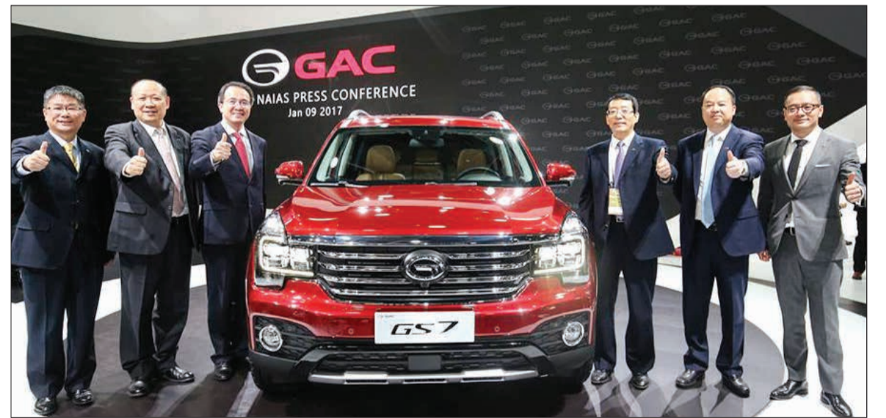
جي أس 7 بعد الكشف عنها في معرض ديترويت

الهيكل الأمامية التفكير التي طورها قسم هندسة جي أيه سي بهدف تقديم موقف من الحرية والتقدم والمتعة عبر التصميم المشترك للسيارة السيدان والرياضية القابلة للتحويل. وستحمل السيارة الجديدة ذات الخمسة مقاعد جي أس 7 التي طورتها جي أيه سي موتور الشعلنة كسيارة تمثل الجيل الجديد من سيارات الدفع الرباعي ذات الشعلنة التي تدمج التقنيات المتطورة ومفاهيم التصميم البارعة. وإذ تعمل بمحرك جي أيه سي من السلسلة جي الجديد 2,0T، فإن الجي أس 7 تستطيع رفع سرعتها من صفر إلى 100 كيلومتر خلال 9,5 ثوان مع ضمان الأداء الرياضي والحد الأدنى من استخدام أداء السيارة في ظروف الطريق المختلفة. ويمكن للسيارة جي أس 7 تلبية الاحتياجات المتنوعة للمستهلكين بتصميم تكنولوجي أكثر تقدماً وأنسنة.