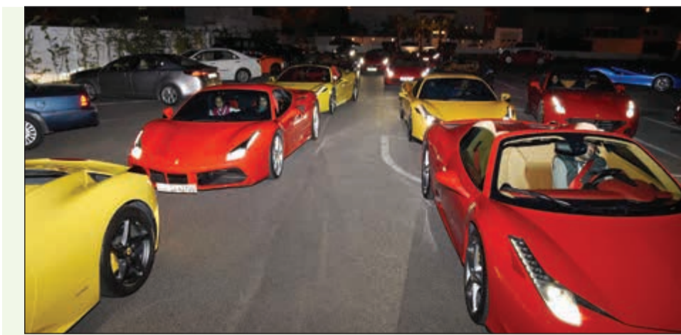
جانب من مسيرة فيراري