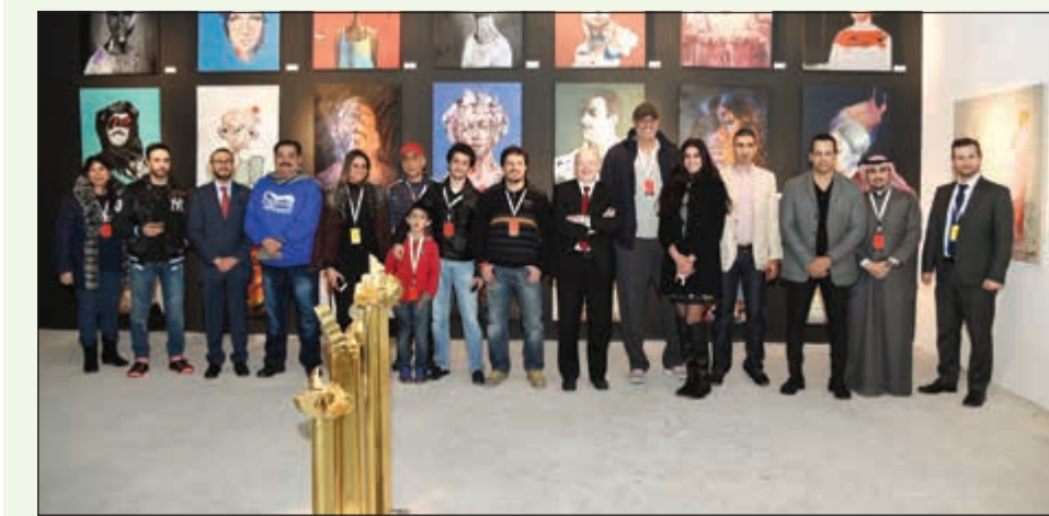
المشاركون خلال تواجدهم في معرض «دن جاليري»