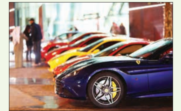
عدد كبير من سيارات فيراري تجتمعت في مكان واحد