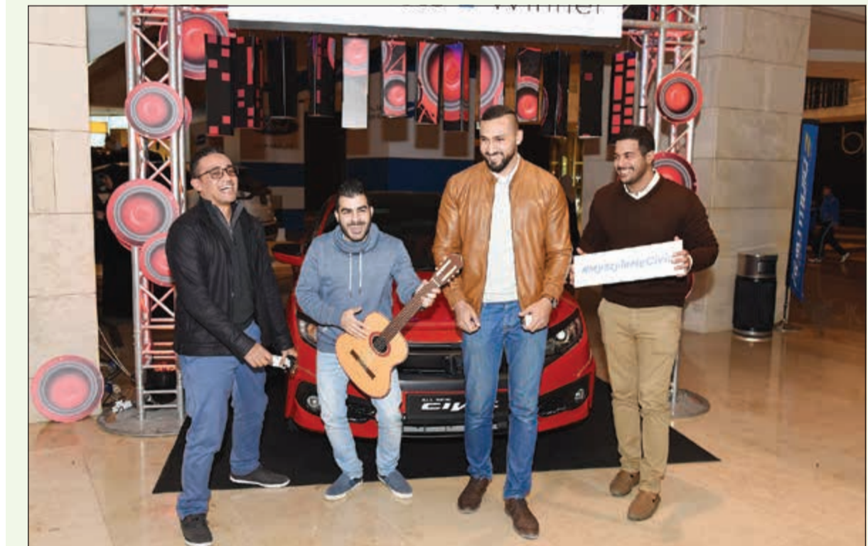
إقبال جماهيري على منصة عرض هوندا سيفيك خلال مشاركتها في معرض «أوتوموتو17»