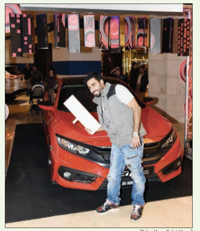
أحد المشاركين بالمسابقة

تمنحنا بداية العام إحساساً بالتجديد والتشويق والتفاؤل، وهو ما نشعر به مع أنشطة هوندا الغانم الجديدة والخاصة بسيارة هوندا سيفيك الجديدة كلياً. وقد أطلقت الشركة مسابقة مشوقة عبر وسائل التواصل الاجتماعي بمشاركة وحضور عدد من مشاهير هذه المواقع التواصلية في الكويت، إضافة للعديد من الأنشطة التي تقودك نحو الجائزة الكبرى: أيقونة الأناقة والتميز، والسيارة الأنسب لأسلوب حياة الشباب، سيارة هوندا سيفيك 2017 الجديدة كلياً. وتعتبر هذه المسابقة الخاصة بهوندا سيفيك 2017 عن تميز هذه السيارة باعتبارها تجمع بين الحيوية والأناقة لتنتقل في حدث تفاعلي على وسائل التواصل الاجتماعي في مسابقة تستمر من 12 يناير حتى 9 فبراير 2017. وكل ما على المشتركين القيام به هو زيارة منصة هوندا سيفيك والنقاط فيديو Boomerang عند السيارة وتحميل الفيديو على إنستغرام المسابقة #MyStyleMyCivic، والمشاركة الذي ينال الفيديو الخاص به أعلى عدد من اللايكات Likes سيكون الفائز بسيارة هوندا سيفيك الجديدة. واستطاعت هوندا سيفيك 2017 أن تضع معايير جديدة ورفيعة المستوى للسيارات المدججة من حيث التصميم الراقى والأداء القوي حيث جاءت هندستها الخارجية بخطوط رشيقة تعطي مظهرها رياضياً للسيارة، إضافة لتطور صناعي في بناء هذه السيارة من حيث معدل