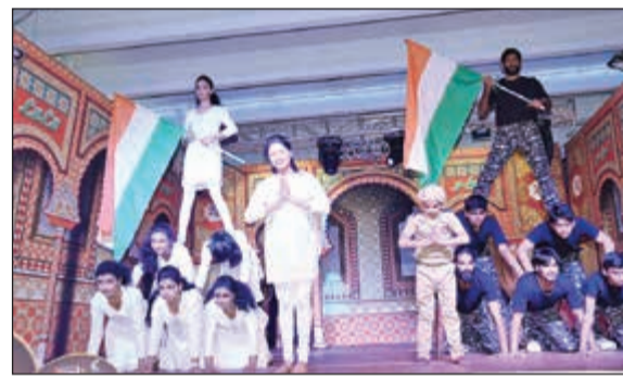
فكرة من البرنامج الثقافي

ذات العلامات التجارية، والسراري المصمم بذوق رفيع، والشوريدار، والكورتا، والأحذية المصنعة بواسطة الحرفيين الهنود في ظل العروض خلال مهرجان إنكريديبل إنديا، وهو منتشر في جميع منافذ لولو هايبر ماركت، جذبا للمتسوقين الباحثين عن صفقات كبيرة على المنتجات الهندية المفضلة لديهم. خلال فترة العرض الترويجي، يحظى زوار لولو هايبر ماركت بفرصة خوض تجربة الاحتكاك الأصيل بالهند.