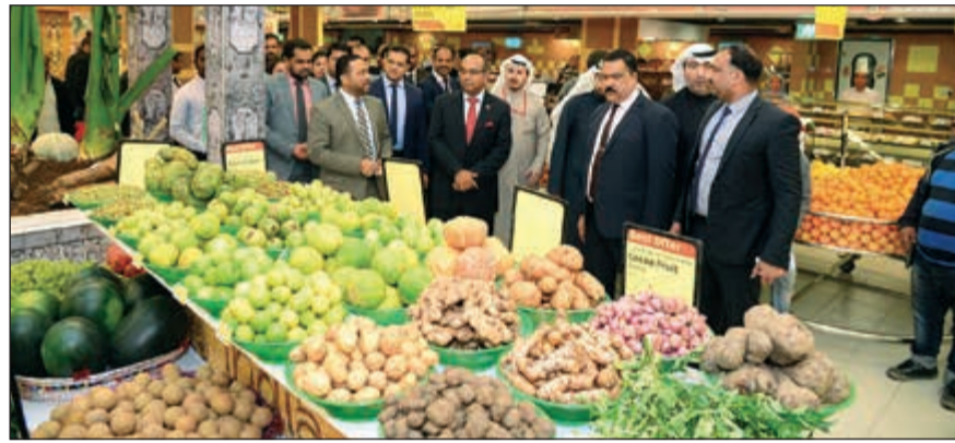
جولة للاطلاع على المنتجات

وقت رائع لإعادة إحياء شغفك بالملايس الهندية مع مجموعة مختارة من الملايس الحرفيين الهنود في ظل العروض خلال مهرجان إنكريديبل إنديا، وهو منتشر في جميع منافذ لولو هايبر ماركت، جذبا للمتسوقين الباحثين عن صفقات كبيرة على المنتجات الهندية المفضلة لديهم. خلال فترة العرض الترويجي، يحظى زوار لولو هايبر ماركت بفرصة خوض تجربة الاحتكاك الأصيل بالهند.