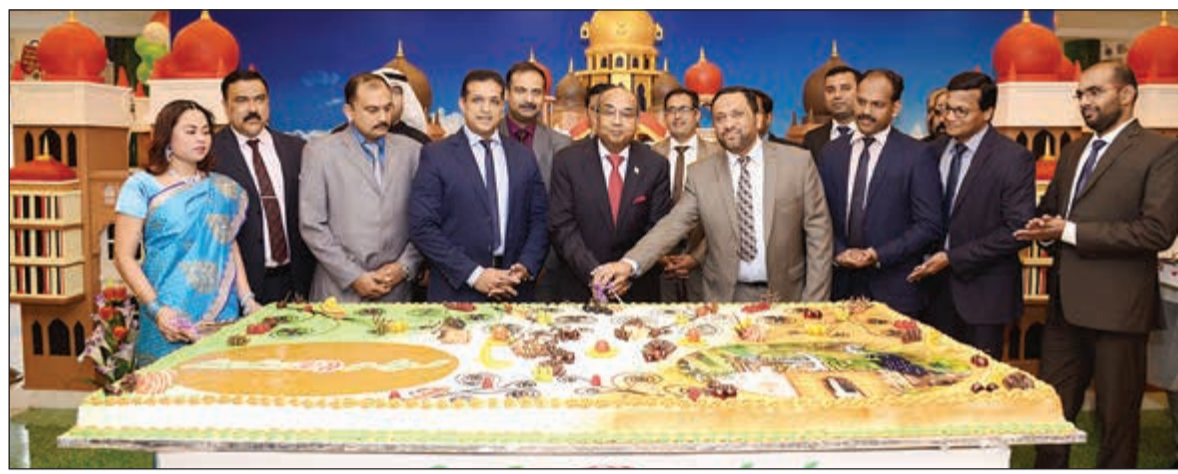
السفير الهندي متوسلا الحضور لدى اطلاق العرض