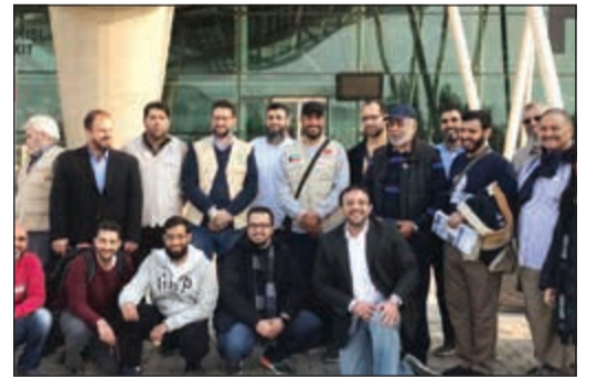
صورة جماعية للفريق الطبي الكويتي