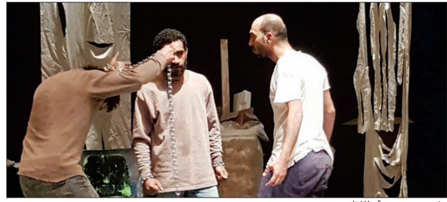
مشهد من مسرحية «المفتاح»

وعرضت مسرحية «المفتاح» على مدى ثلاثة أيام على خشبة مسرح الصالة