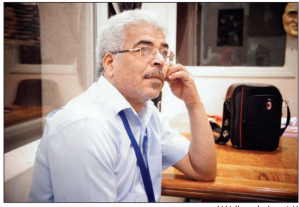
المخرج إبراهيم الخلفان

البحث عن «مفتاح الحب» وأن الجميع يشاركون أبطال المسرحية همومهم في البحث عن الحرية التي يسعى إليها الإنسان للتعلم بها. تدور أحداث المسرحية حول ثلاثة أصدقاء احدهم شخصيته غريبة يقوم بربط نفسه وأصدقائه بـ «سلسلة» ليعزلهم عن العالم الخارجي ويقوم بالتسلط عليهم في محاولة منه لإقناعهم بالبقاء