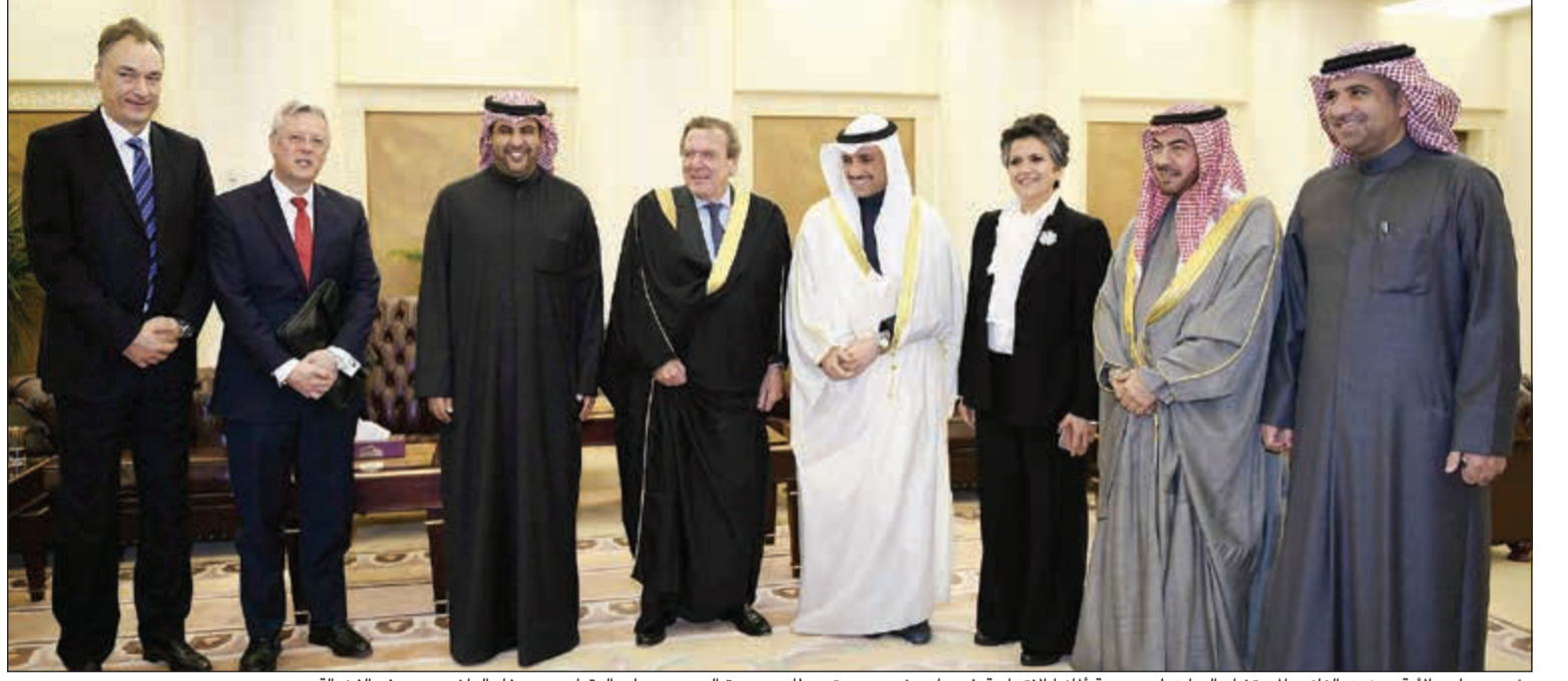
رئيس مجلس الأمة مرزوق الغانم والمستشار السابق لجمهورية ألمانيا الاتحادية غيرهارد شرويدر يتوسطان د.عودة الرويعي وعلي الدقباسي وصفاء الهاشم ويوسف الفضالة

البرلمانية النائب علي سالم الدقباسي، ومقرر اللجنة النائب يوسف صالح الفضالة والنائبة صفاء عبدالرحمن الهاشم.