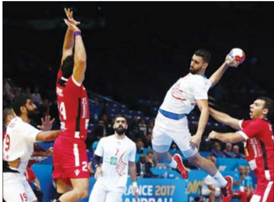
ندية كبيرة شهدها اللقاء بين المنتخبين المصري والبحريني

استعاد المنتخب المصري توازنه وعوض خسارته السيت أمام البطلة الأוליبيّة الدنمارك، بتغلبه على نظيره البحريني 31-26 في الجولة الثالثة من منافسات المجموعة الرابعة لبطولة العالم في كرة اليد المقامة في فرنسا التي ضمنت تواجدها في الدور الثاني بفضل روسيا. وهو الفوز الثاني لأبطال إفريقيا، بعد الذي حققوه في الجولة الأولى على حساب قطر وصيفة بطل 2015، فعززوا حظوظهم ببلوغ الدور الثالث للمرة الثالثة تواليا.