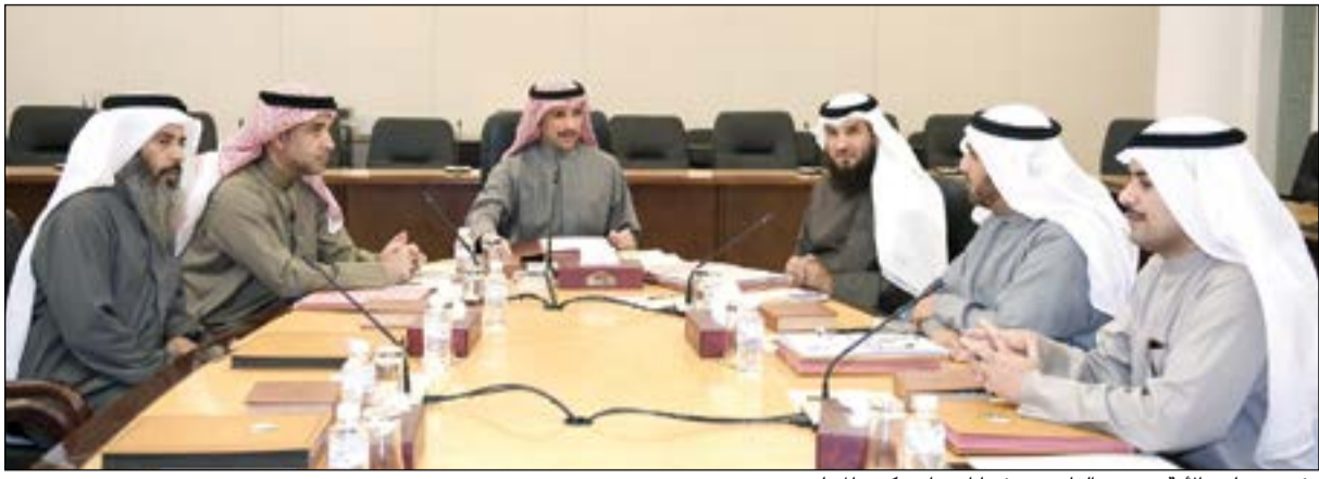
رئيس مجلس الأمة مرزوق الغانم متفرسا اجتماع مكتب المجلس

وقال ان المجلس اعتمد خلال اجتماعه جدول اعمال جلسة 31 يناير، والتي ستبدأ باستمرار مناقشة