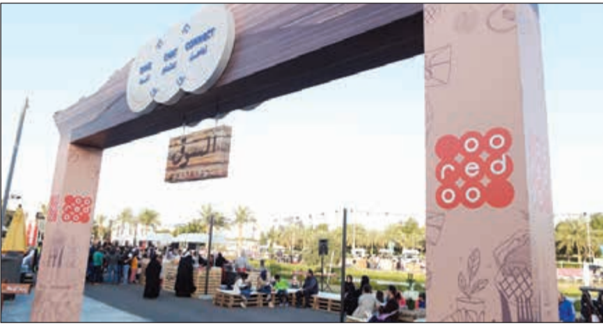
مدخل سوق مروج