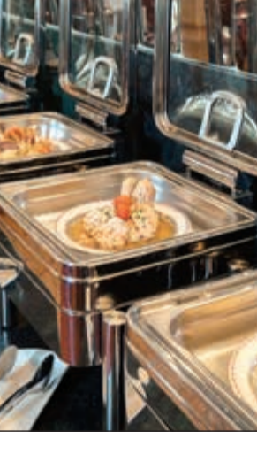
أشهى المأكولات الآسيوية

الآن وكل ليلة جمعة، يمكن للضيوف اكتشاف لأنحة ساحرة من الأطباق الآسيوية والاستمتاع ببوفيه يجمع ألذ الأصناف المعدة ببراعة من مختلف بلدان آسيا مثل الهند والصين واليابان وتايلاند مع الخبرة الطهي الحي لأطباق التوليد لتترك أمامك لأنحة ساحرة تنقلك إلى سحر الطبيعة والأصالة، ويقع مطعم الدلة في طابق الميزانين بفندق ان اند غو كويت بلازا يتسارع فهد السالم.