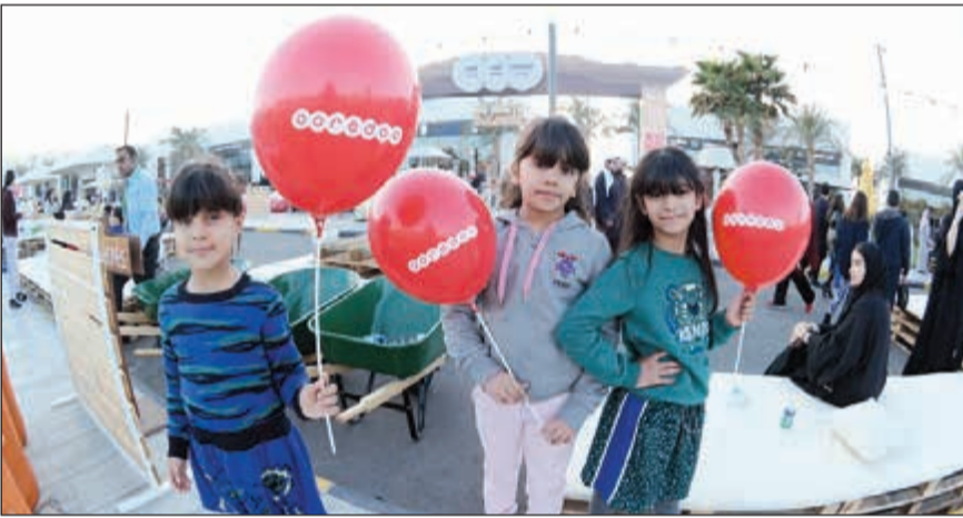
هدايا لزوار السوق