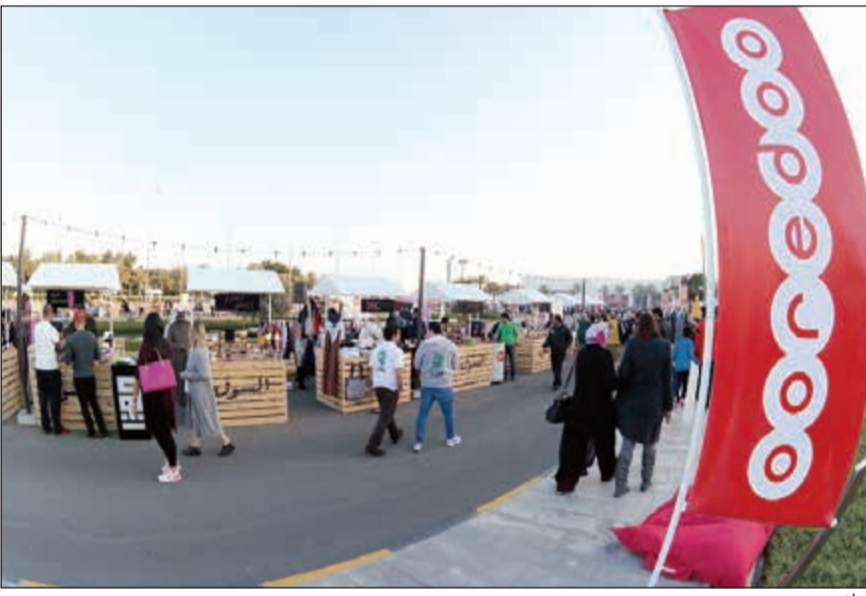
جانب من سوق مروج