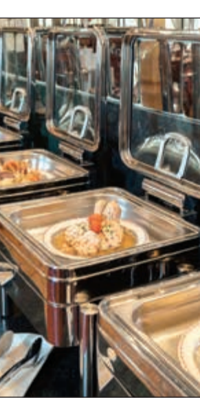
أشهى المأكولات الآسيوية