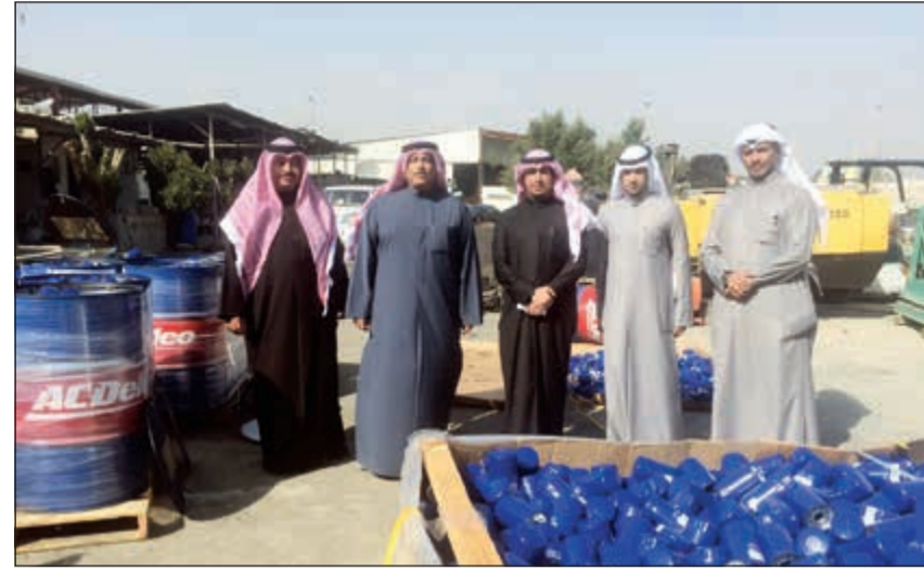
الفريق المشارك في عملية الضبط