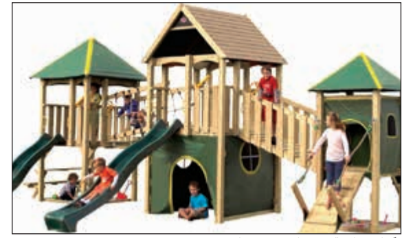
العاب خاصة عند فانتسي وورلد