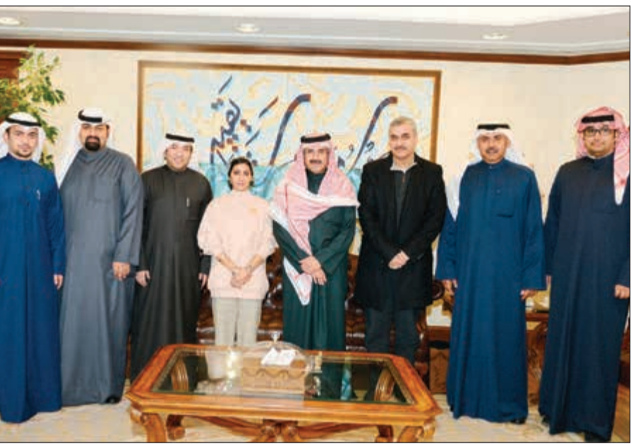
الشيخ مبارك الدعيج مستقبلاً شباب مسابقة مبارك الحمد للتميز الصحفي

للمشيع مبارك الدعيج على حفاوة الاستقبال ودعمه للشباب الكويتيين العاملين في الوكالة ما يمنحهم حافزاً متجدداً لمزيد من العطاء والتفاني. وأكد العلي أن المسابقة مستمرة في التنوع وتقديم كل جديد في مجال الإعلام بشتى تخصصاته، مبيناً أنها تولي الشباب عناية خاصة ومتابعة حثيثة من خلال الدورات التي تقام داخل الكويت وخارجها بالتعاون مع كبريات المؤسسات الإعلامية في العالم. ولفت إلى أن هذه المتابعة والرعاية تمثل ترجمة حقيقية لاهتمام راعي المسابقة وداعمها سمو رئيس مجلس الوزراء الشيخ جابر المبارك بالشباب الكويتيين العاملين في مجال العمل الصحفي ككل.