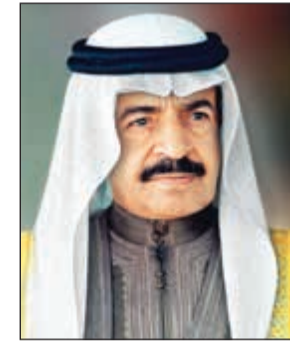
صاحب السمو الملكي الأمير خليفة بن سلمان آل خليفة

النامية - بنا: أكد صاحب السمو الملكي الأمير خليفة بن سلمان آل خليفة رئيس الوزراء البحريني أنه لا حليف أصدق وأوثق وأقوى للأمة العربية والإسلامية من المملكة العربية السعودية لمكانتها وثقلها العالين، وأن الاتحاد تجربة ناجحة في الخليج ودولة الإمارات العربية المتحدة ودليل ساطع على ذلك، ومنتطلع لاتحاد خليجي يعزز تعاوننا. وأشار لدى لقاء سموه بأعضاء اتحاد الصحافة الخليجية إلى أن قادة دول