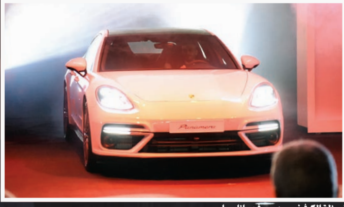
لحظة الكشف عن بورشه باناميرا