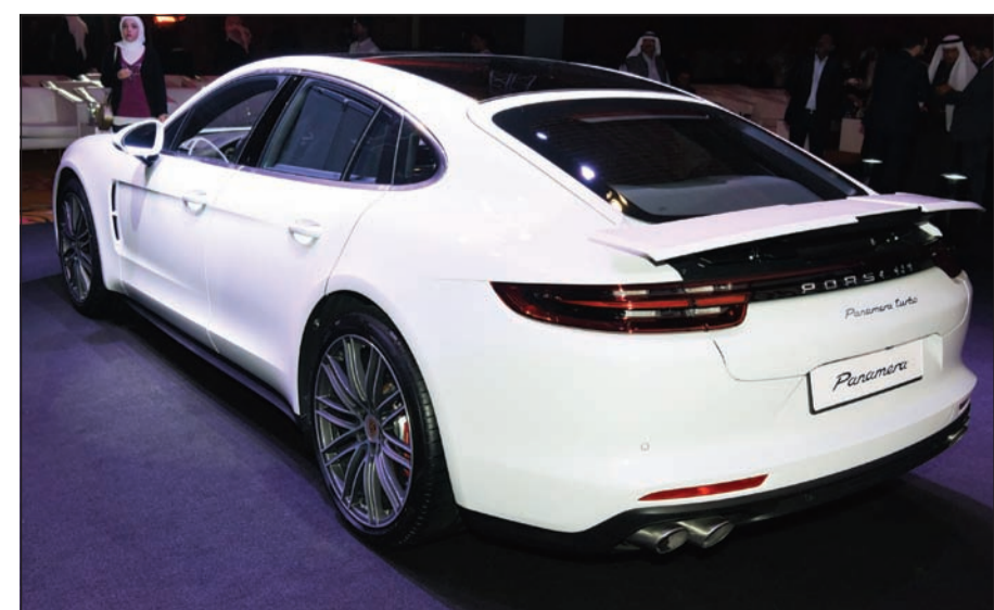
التصميم الخلفي يبرز طابع الكوبيه رباعي الأبواب