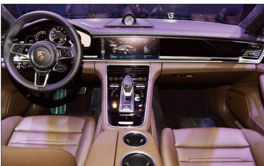
مقصورة عصرية مطورة بالكامل