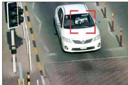
صورة تداولها مستخدمو وسائل التواصل على إحدى المخالفات

وكانت وسائل التواصل نشرت معلومات عن رفع قيمة مخالفة استخدام الهاتف أثناء القيادة بواسطة اليد الى 100 دينار وان كاميرات المراقبة تترصد المخالفين