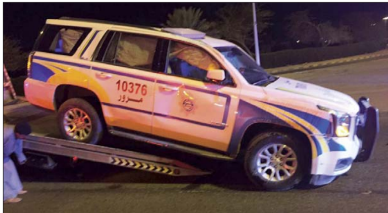
.. وفي طريقها الى كراج التصليح