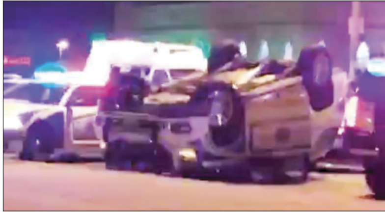
الدورية عقب انقلابها مباشرة