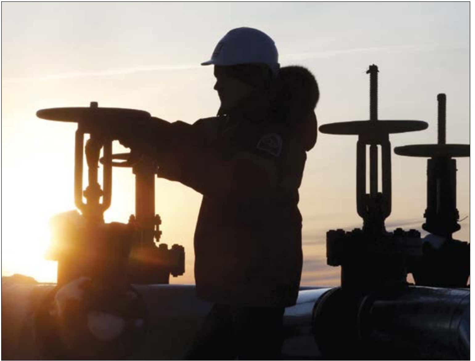
هل يعلق أعضاء «أوبك» غير الكويت والسعودية أنابيب النفط ويلتزمون بالاتفاق التاريخي؟!..في الصورة عامل يعاين أنبوب نفط في حقل تابع لروسيا

طوكيو - رويترز: قال مصدر مطلع على جدول تحمييلات الناقلات الأولى لإيران إن صادرات طهران من المكثفات تتجه للانخفاض 17٪ إلى أدنى مستوياتها في خمسة أشهر هذا الشهر مع قيام المشتري الرئيسي كوريا الجنوبية بتقليص المشتريات للنصف تقريبا وشراء كميات إضافية من قطر. ومن المنتظر أن تبلغ تحمييلات المكثفات في يناير نحو 385 ألف برميل يوميا انخفاضا من 462 ألف برميل يوميا في ديسمبر وفقا لتقديرات. وانحسرت شحنات المكثفات منذ بلغت ذروة 2016 عند 560 ألف برميل يوميا في