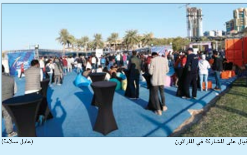
إقبال على المشاركة في الماراثون (عادل سلامة)