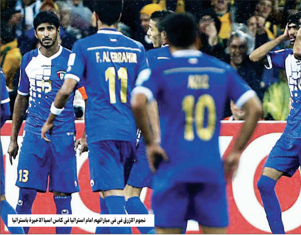
نجوم الأزرق في في مباراتهم، امام استراليا في كأس اسيا الاخيرة باستراليا