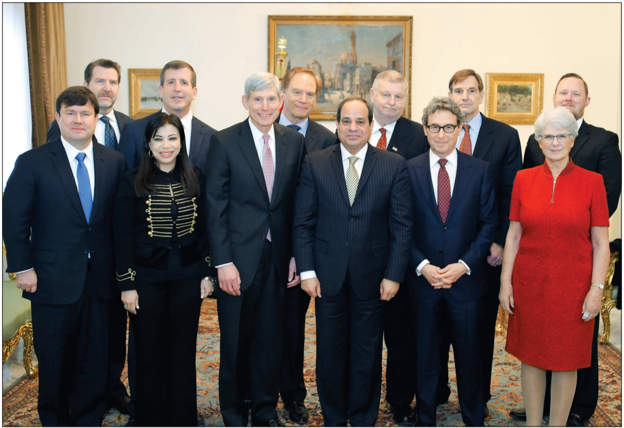
الرئيس المصري عبدالفتاح السيسي مستقبلاً وفداً من مجلس أعمال الأمن القومي الأميركي أمس الأول

الأصعدة بما يعود بالنفع على البلدين، مضيفاً أن الرئيس استعرض آخر المستجدات التي تشهدها مصر على الصعيدين الاقتصادي والسياسي، بما في ذلك جهود الحكومة للنهوض بالاقتصاد وتنمية مختلف القطاعات وتنفيذ برنامج إصلاح شامل، لمعالجة المشكلات الهيكلية التي ظل يعاني منها الاقتصاد المصري لعقود، فضلاً عن التعديلات التشريعية والإجرائية التي تتم من أجل توفير مناخ جاذب للاستثمار. وتطرق السبسي إلى المشروعات القومية الجاري تنفيذها، وعلى رأسها مشروع تنمية محور قناة السويس، مؤكداً عزم مصر على الاستمرار في تنفيذ المزيد من الإصلاحات السياسية والاقتصادية والاجتماعية لتحقيق التنمية الشاملة، رغم ما تواجهه من تحديات أمنية بسبب المخاطر الإرهابية. وأعلن السبسي تنفيذ مصر لخطة تنمية متكاملة في سيناء، لتلبية الاحتياجات