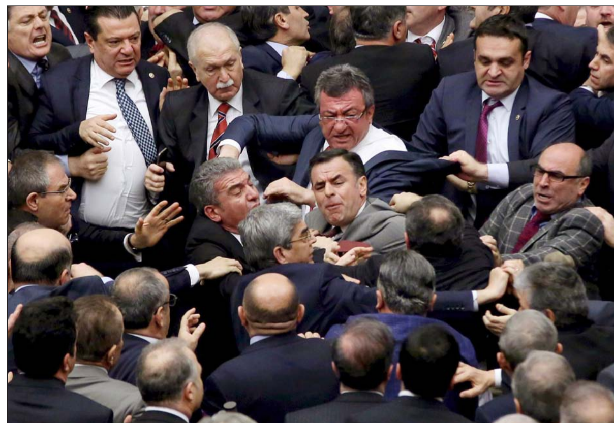
نواب حزبي العدالة والتنمية والشعب الجمهوري خلال الشجار في البرلمان التركي

استمرت حتى الساعات الأولى من صباح أمس، ويتعين أن تلقى التعديلات تأييد 330 عضواً على الأقل من جملة 550 عضواً بالبرلمان لطرحتها في استفتاء.