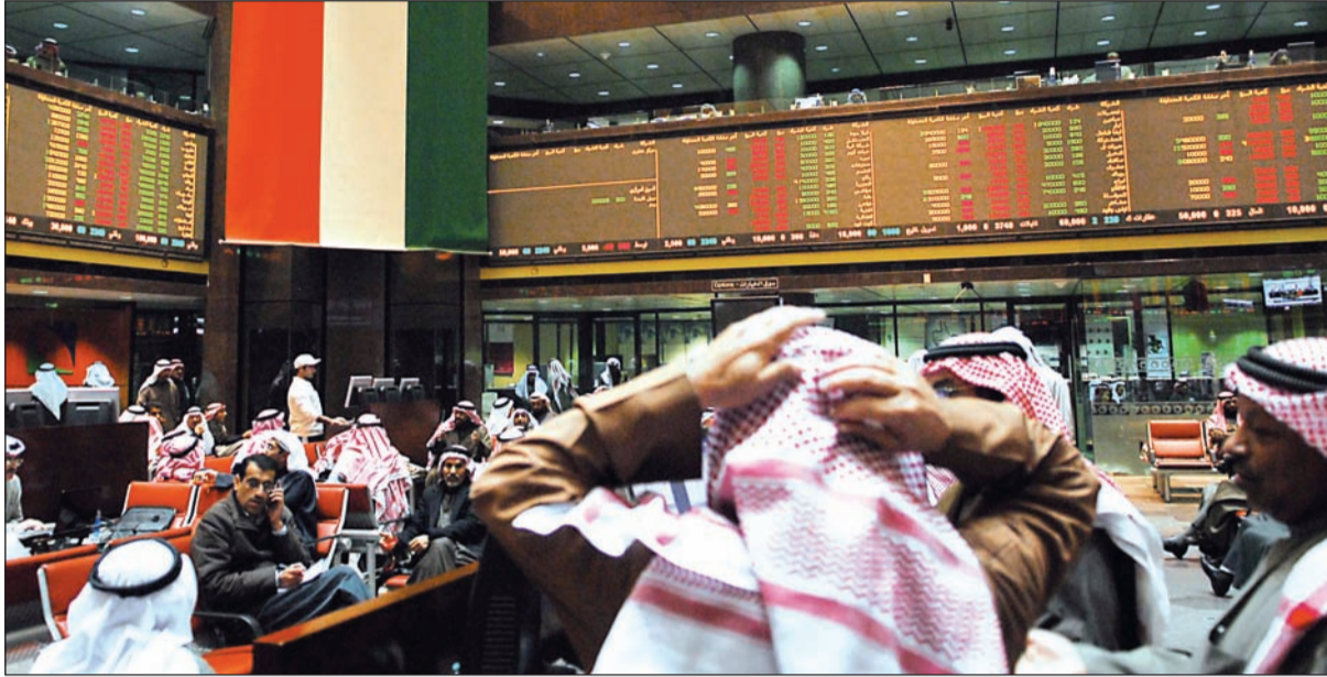
الصعود المتتالي يعزز الثقة والإقبال على البورصة

197 مليون دينار حصيدا سيولة الأسبوع.. والمتوسط قفز إلى 39 مليون دينار «السعري» اخترق 6000 نقطة للمرة الأولى منذ 17 شهراً.. ومكاسبه 6,5% من بداية السنة