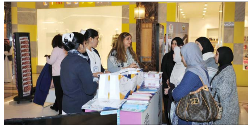
إقبال من رواد مجمع غيت مول على الاستفادة من خدمات اليوم التوعوي

وأوضحت أن المرحلة المتقدمة من المرض تتطلب مساعدة شاملة على مدار الساعة لأن المريض يعاني فيها من صعوبة في الأكل والبلع وفقدان القدرة على الكلام والمشى وغيرها.