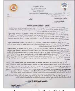
صورة زنگرافية من ردا ديوان الخدمة المدنية