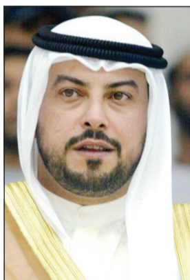
الشيخ د. طلال الفهد

أجرى رئيس اللجنة الأولمبية واتحاد الكرة السابق الشيخ د. طلال الفهد في لندن عملية جراحية كان قد أعلن عنها سابقاً، والتي تكلفت بالحاج. وتوجه الفهد برسالة إلى محبيه قبل دخوله إلى غرفة العمليات قائلاً، نستودعكم الله الذي لا تضيع ودائعه.. السلام عليكم..