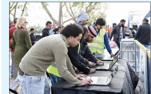
إقبال كبير على التسجيل