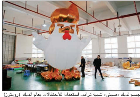
مجمس ليدك صيني، شبيه ترامب استعدادا للاحتفالات بعام الديك

عواصم - وكالات: رسمت الصحافة البريطانية صورة قائمة لفترة حكم الرئيس الأميركي المنتخب دونالد ترامب، واعتبرت صحيفة «الإنديبنت» أن أولى «مأسي» رئاسته تازم علاقته بمخابرات بلاده، والتي أجمعتها قضية علاقته بروسيا، والمزاعم الاستخباراتية حول امتلاك موسكو معلومات محرجة عنه. وبعد أن توعد ترامب بمعاينة الاستخبارات لتسريبها معلومات مختلفة، أعرب مديرها جيمس كلابر عن «استيائه الكبير» لتسريب تفاصيل لم يتم التحقق من صحتها، مؤكداً أن أجهزته ليست مصدر تسريب هذه المعلومات. أما بطل هذه التسريبات، فقد كشفت وسائل إعلام أنه ضابط استخبارات بريطاني سابق يدعى كريستوفر ستيل سبق أن عمل متخفياً كديبلوماسي لدى روسيا وباريس. وقالت أنه أجرى تحريات حول ترامب لصالح جمهوريين، بينهم جب بوش، رغبوا في منعه من الفوز بترشيح حزبه للرئاسة.