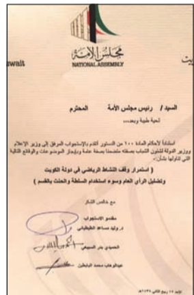
صورة زكوةغرافية لغللاف الاستجواب

المساءلة السياسية في ديوان الطببائي مساء أمس على أن يقدم الاستجواب صباح الأحد المقبل. وقال النائب الطببائي إن الاستجواب يتضمن، بالإضافة إلى موضوع إيقاف النشاط الرياضي، التجاوزات المالية والإدارية في وزارة الإعلام. ورغم بدء عطلة نهاية الأسبوع، إلا أن مجلس الأمة كان حافلا أمس بالنشاط البرلماني لجهة المواقف السياسية أو التصويب نحو عدد