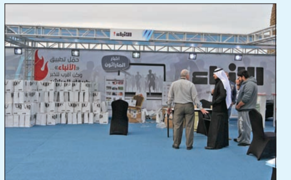
جتاح «الأنباء» في الماراثون (قاسم باشا - ريليش كومار)