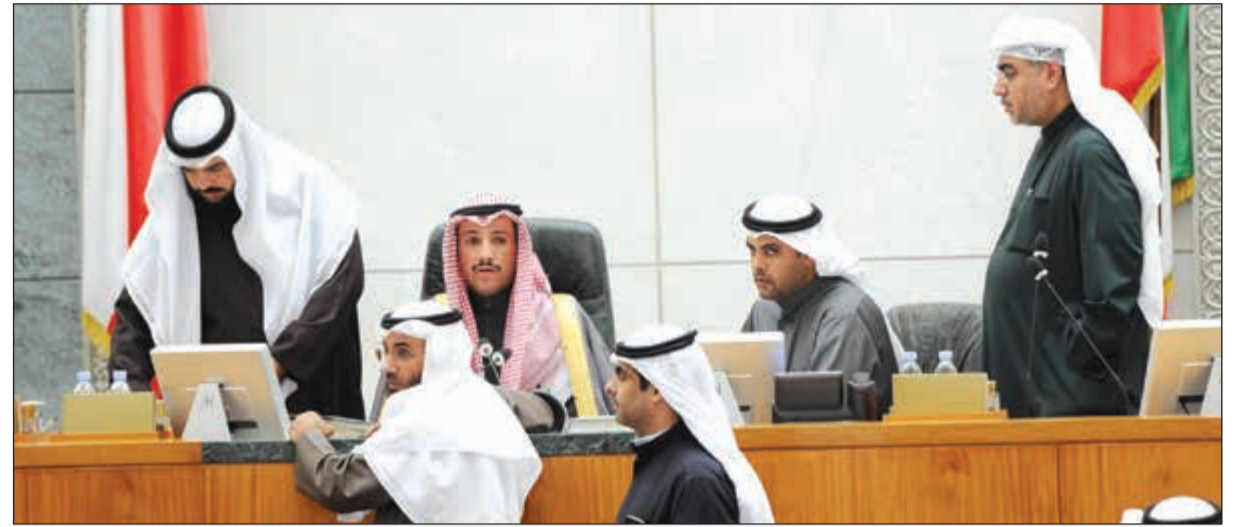
رئيس مجلس الأمة مرزوق الغانم وخالد الشطي ويوسف الفضالة ود.جمعان الحريش ورياض العبدانسي وعلام الكندري أثناء الجلسة

يحتوي هذه الاعداد. هناك خلل حقيقي ولا توجد رؤية حقيقية للدولة. هناك خلل في كل القطاعات وهذا دورنا في مصالحة الخلل لتقديم شيء للاجيال القادمة والشباب.